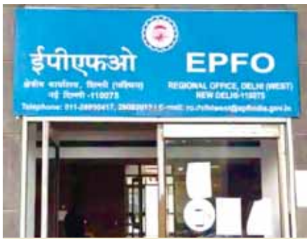
नौकरीपेशा लोगों के लिए श्वेतकमल ने राहत की खबर दी है। अब EPFO खाताधारक 31 दिसंबर तक अपना ह आधार के साथ लिंक कर सकते हैं। पहले राह सीमा। सितंबर तक थी।