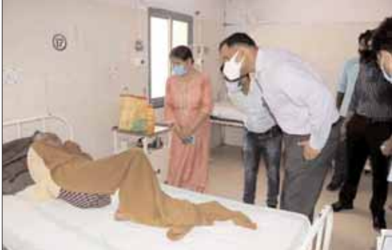
अस्पताल में हो बेहतर साफ-सफाई