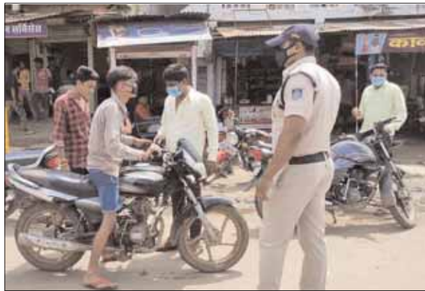
नरसिंहपुर यथाप्र। रोको-टोको अभियान के तहत शनिवार 11 सितंबर को जिले के 8 नगरीय निकायों में बगैर मास्क के घूमने वाले 122 व्यक्तियों पर 7 हजार 590 रुपये का जुर्माना लगाया गया है। मास्क

नहीं लगाने पर नगरीय निकाय क्षेत्र नरसिंहपुर में 14 व्यक्तियों पर 810 रुपये, गाडवारा में 18 व्यक्तियों पर 1400 रुपये, करेली में 9 व्यक्तियों पर 850 रुपये, गोटेगांव में 6 व्यक्तियों पर 320 रुपये, तेंदूखेड़ा में