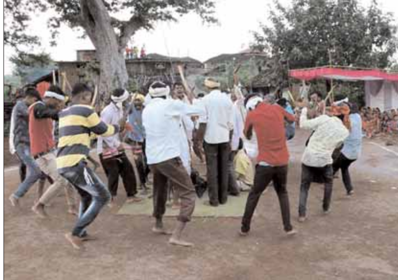
के दौरान आलाधिकारियों ने ग्रामीणों से विस्तृत चर्चा कर उनकी समस्याएँ जानी एवं मौके पर मौजूद अधिकारियों को आवश्यक दिशा निर्देश दिये।