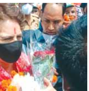
रायबरेली आने वाले सभी बड़े नेता चुरवा हनुमान मंदिर में माथा टेककर

रायबरेली। कांग्रेस महासचिव व यूपी प्रभारी प्रियंका गांधी वाड्ढे दो दिवसीय दौरे पर रायबरेली पहुंच गई हैं। यहां वह कई कार्यक्रमों में हिस्सा लेंगी और पदाधिकारियों संग बैठक करेंगी। रायबरेली के रास्ते में लखनऊ रायबरेली सीमा पर प्रियंका गांधी ने चुरवा हनुमान मंदिर में माथा टेका और पुजारी से आशीर्वाद लेकर प्रसाद ग्रहण किया। बता दें कि विधानसभा चुनाव हों या फिर लोकसभा चुनाव,