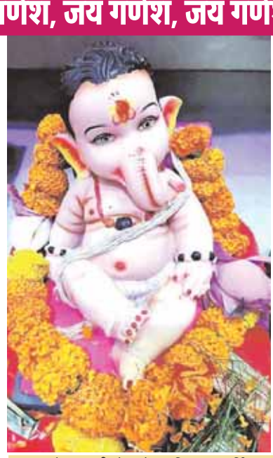
आजाद चौक बावली टोला में स्थापित मंगलमूर्ति।