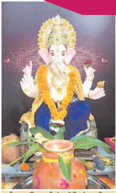
महरी माता मंदिर बावली टोला में विराजे गणपति।