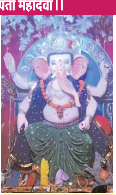
सम्राट गली पुरानी बस्ती में विराजमान गणपति।