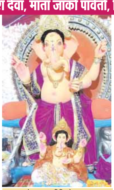
नवयुवक गणेश उत्सव समिति, रोशननगर।