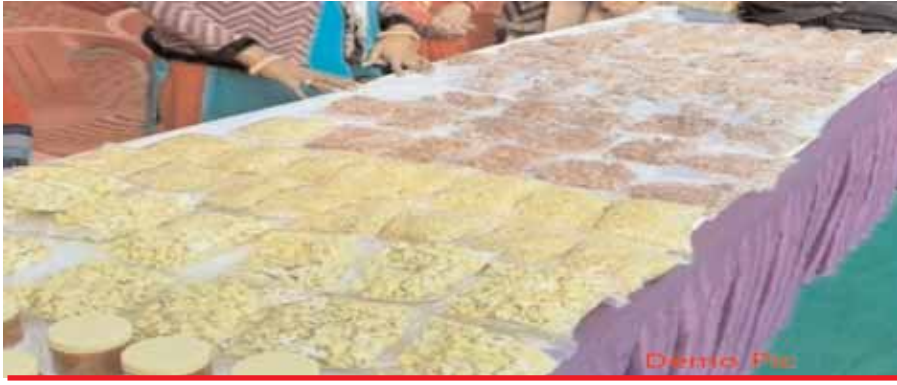
ई-कॉमर्स कंपनियों से समझौता

भोपाल। महिला स्व-सहायता समूहों (एसएचजी) के उत्पाद आने वाले समय में अंतरराष्ट्रीय बाजार में अपनी छाप छोड़ेंगे। मध्य प्रदेश राज्य आजीविका मिशन अंतरराष्ट्रीय बाजार में समूहों के उत्पाद और फसलों को उतारने के लिए बहुराष्ट्रीय कंपनियों से समझौता करने जा रहा है। इससे न सिर्फ समूहों का कारोबार बढ़ेगा। बल्कि मुनाफा बढ़ने से समूह की महिलाओं की आर्थिक स्थिति में भी सुधार होगा। मिशन ने इस दिशा में काम शुरू कर दिया है। मध्य प्रदेश में स्व-सहायता समूह तेल, आटा, बेसन, दालें, नमकीन, बिस्किट, धो, मावा, मिठाई सहित अन्य खाद्य पदार्थ, गारमेट, खिलौने, सजावटी सामान और मेडिकल उत्पाद तैयार कर रहे हैं। वे दूध, सब्जी और मौसमी फलों का भी उत्पादन कर रहे हैं, पर उन्हें मेहनत और प्रयासों के मुताबिक लाभ नहीं मिल रहा है। यही कारण है कि समूह की महिलाओं की आमदनी में ज्यादा फर्क नहीं आया है। संतुष्टि सिर्फ इतनी है कि उन्हें मजदूरी नहीं करना पड़ रही और उससे कुछ ज्यादा राशि मिल जाती है और सम्मान भी। सरकार इसे काफी नहीं मानती है। इसलिए उनके उत्पादों को अंतरराष्ट्रीय बाजार में उतारने की कोशिश की जा रही है। पिछले दिनों