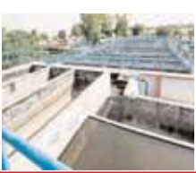
इन्हें रहेगी छूट

भोपाल। भूजल संसाधनों के संरक्षण के लिए केंद्रीय भूमि जल प्राधिकरण ने नई गाइडलाइन जारी की है। इसके तहत भूजल उपयोग के लिए अनुमति लेनी होगी। जिला कलेक्टरों को इसकी निगरानी की जिम्मेदारी सौंपी गई है। अनापत्ति प्रमाण-पत्र (एनओसी) प्राप्त करने से दूढ़ सिर्फ घरेलू उपयोग और कृषि कार्य के लिए होगा। एनओसी नहीं लेने और एनओसी की शर्तों के उल्लंघन पर अलग-अलग रूप में पांच हजार से लेकर कम से कम दो लाख रुपये तक के जुर्माने का प्रविधान किया गया है। शहरी क्षेत्रों में हाउसिंग सोसायटियों और सरकारी जलापूर्ति एजेंसियों को एनओसी के लिए सीवेज परिशोधन (ट्रीटमेंट) संयंत्रों की स्थापना करनी होगी। इसके अभाव में एनओसी नहीं मिलेगी।