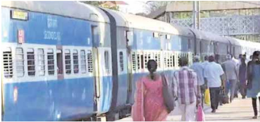
जबलपुर मण्डल पर चलने वाली गाड़ी संख्या 01450 श्रीमाता वैष्णोदेवी कटरा से जबलपुर स्पेशल

कटनी। कटनी मुड़वारा जंक्शन होकर चलने वाली गाड़ी संख्या 01450 श्रीमाता वैष्णोदेवी कटरा-जबलपुर स्पेशल ट्रेन की समय सारिणी में रेलवे ने संशोधन किया है। अभी तक यह गाड़ी वापसी में सुबह 4 बजकर 20 मिनट पर कटनी मुड़वारा स्टेशन पहुंचती थी लेकिन अब संशोधित समय सारिणी के अनुसार यह ट्रेन रात 2 बजकर 55 मिनट पर कटनी मुड़वारा स्टेशन पहुंचेगी और 3 बजे जबलपुर के लिए रवाना हो जाएगी। जानकारी के मुताबिक पश्चिम मध्य रेल के