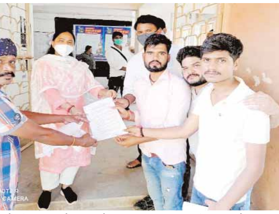
कटनी। एसीसी के नए प्रोजेक्ट में वायदे के अनुरूप स्थानीय युवाओं को रोजगार नहीं मिल रहा। एसीसी प्रबंधन की दमनकारी नीतियों के कारण किसान भी परेशान है।

उल्लेखनीय है कि लगभग 1800 करोड़ की लागत से अमहटा में एसीसी का 3 मिलियन टन छमता का नया प्लांट स्थापित होना है जिसका निर्माण कार्य तेज गति से जारी है। प्लांट निर्माण शुरू होने से पहले पर्यावरणीय स्वीकृति के लिए आयोजित जनसुनवाई के दौरान जिला प्रशासन, जनप्रतिनिधियों एवम प्रदूषण नियंत्रण बोर्ड के अधिकारियों की मौजूदगी में एसीसी प्रबंधन ने नए प्लांट में 70 फीसदी रोजगार स्थानीय युवाओं को देने की बात कही थी साथ ही पर्यावरण सुधार के लिए वृहद वृक्षारोपण किये जाने की घोषणा भी की थी। जिन किसानों की जमीन उद्योग के लिए अधिग्रहित की गई थी उन्हें भी पर्याप्त मुआवजा और परिवार के सदस्यों को रोजगार देने का सपना दिखाया गया था। इसी साल जनवरी में जब प्लांट निर्माण के की आधारशिला रखने मुख्यमंत्री शिवराज सिंह चौहान अमहटा आये थे तब उन्होंने भी नए प्लांट में 70 फीसदी रोजगार स्थानीय लोगों को ही दिए जाने का भरोसा दिलाया था। स्थानीय युवाओं का आरोप है कि एसीसी प्रबंधन अब न तो अपने वायदे पर अमल कर रहा ना ही मुख्यमंत्री की घोषणा का पालन कर रहा। नये