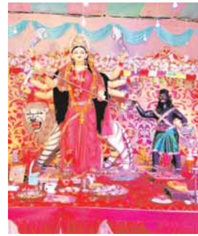
खलवारा बाजार कैमोर में विराजी आदिशक्ति जगदम्बा।