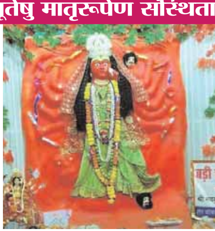
श्री नवयुवक दुर्गात्सव समिति, शेर चौक।