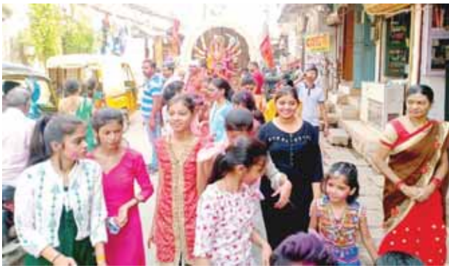
शेर चौक दुर्गास्व समिति की दुर्गा प्रतिमा का विसर्जन आज दोपहर किया गया

आ रही है। पहले के सालों में ऐसा होता भी आया है। 8 दिन के नवरात्र होने के बाद भी कटनी में नवरात्र का पर्व पूरे 9 दिनों तक धूमधाम से मनाया जा रहा है। पंचांग के मुताबिक इस बार नवरात्र का पर्व 8 दिनों का था, लेकिन शांति समिति की बैठक में इस बात का ध्यान नहीं रखा गया और 16 अक्टूबर की बजाए 15 अक्टूबर को दशहरा मनाए जाने का निर्णय लिया गया, जबकि 15 अक्टूबर को शहर में नवरात्र की नवमी मनाई गई और विभिन्न देवी मंदिरों के जवारा का विसर्जन किया गया। यही कारण है कि 15 अक्टूबर को दशहरा के अवसर पर दुर्गा प्रतिमाओं के दर्शनार्थ शहर की सड़कों पर अपार जनसैलाब उमड़ पड़ा। जवारा विसर्जन के दूसरे दिन विजयादशमी का पर्व मनाए जाने की परंपरा सालों से चली आ रही थी, लिहाजा शहर की सभी दुर्गास्व समितियों ने इस बार भी इस परंपरा का निर्वहन किया और जवारा विसर्जन के दूसरे दिन यानि आज दुर्गा प्रतिमाओं का विसर्जन किया जा रहा है।