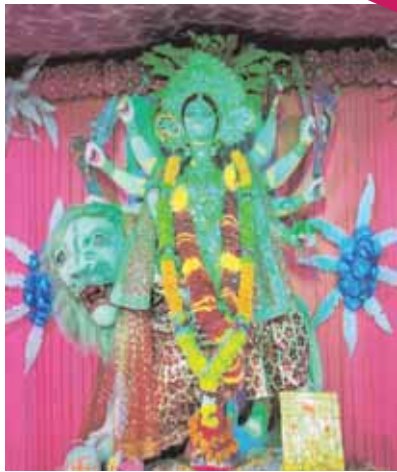
श्री सत्संग दुर्गात्सव समिति, पन्ना मोड़।

या देवी सर्वभूतेषु मातृरूपेण संस्थिता, नमस्तस्यै नमस्तस्यै नमस्तस्यै नमो नमः ॥