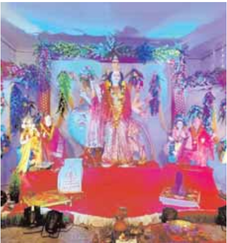
एवरस्ट इंडस्ट्रीज कैमोर में स्थापित मां दुर्गा की भव्य प्रतिमा।