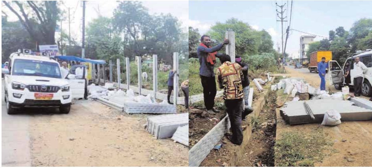
मौके पर कार्रवाई करते जिला प्रशासन के अधिकारी एवं अवैध रूप से किए गए अतिक्रमण को हटाने के कार्य में।

कटनी। मुख्यमंत्री शिवराज सिंह चौहान ने सम्पूर्ण प्रदेश में भू-माफियाओं के विरुद्ध सख्त कार्रवाई करने के निर्देश अधिकारियों को दिये। जिसके तहत शासकीय भूमि पर अवैध कब्जा करने वालों के विरुद्ध जिले में कार्रवाई जारी है। इसी क्रम में बुधवार को झिंझरी में पुनर्वास शीट क्रमांक 12 के प्लॉट पर किये जा रहे अवैध कब्जे को प्रशासन ने त्वरित कार्रवाई करते हुये तत्काल प्रकरण दर्ज कर स्थगन आदेश जारी कर दिया गया है। इस भूमि का वर्तमान बाजार मूल्य लगभग 5 करोड़ रुपये है।