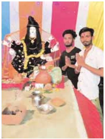
न्यू दुर्गात्सव समिति, भारत चौक कुआं के पास।