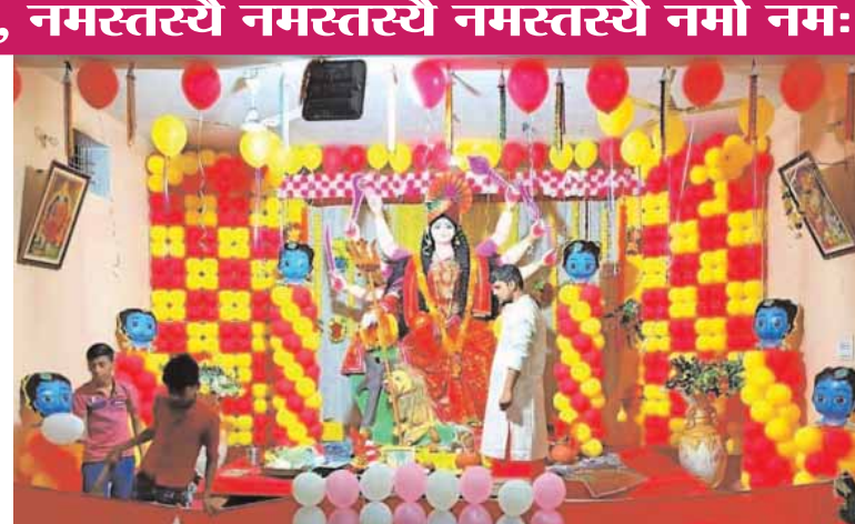
श्री राम दुर्गात्सव समिति, दुर्गा चौक।