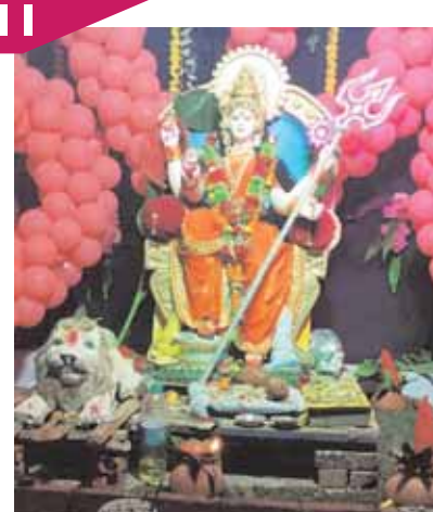
बजरंग दुर्गात्सव समिति, बड़ी खिरहनी।