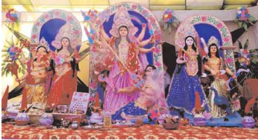
बालक प्रेरणा दुर्गात्सव समिति, सम्राट गली पुरानी बस्ती।