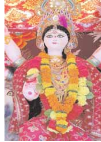
रगनाथ मंदिर के पास स्थापित मां भवानी।