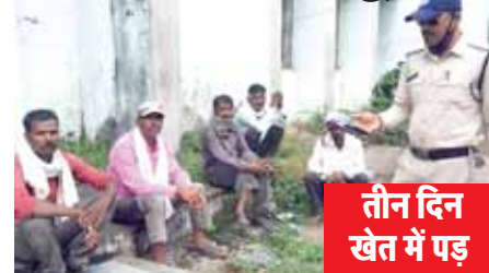
तीन दिन खेत में पड़ रहा शव, घर से गायब दामाद की खबर तक नहीं दी किसी को