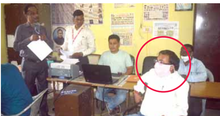
लोकायुक्त को देख तारीख भूल गया बीआरसी बिल निकलवाने लेखापाल से मांगे थे 12 हजार रूपए

जबलपुर, यशभारत। जबलपुर के शिक्षा विभाग दूर में एक बार फिट लोकायुक्त ने छापा मारकर एक अधिकारी को 6 हजार की रिश्वत के साथ गिर तार किया। लोकायुक्त की दबिश देते ही कार्यालय में हड़कंप मच गया, रिश्वतखोर अधिकारी भागने की फिराक में बाहर जाने लगा जिसे दोड़कर पकड़ा गया।