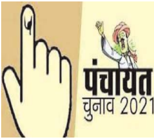
के लिए हुए आरक्षण को नियम विरुद्ध करार देते हुए इसके विरोध में उच्च न्यायालय में याचिकाएं दायर कर दी गईं। उच्च न्यायालय

गौरतलब है कि प्रदेश में ग्राम पंचायतों सहित जनपद पंचायतों एवं जिला पंचायतों का कार्यकाल जनवरी 2020 में ही पूरा हो चुका है। कार्यकाल पूरा होने के पश्चात नये चुनाव के लिए तैयारियां भी 2020 में शुरू हो गई थीं। पंचायतों की मतदाता सूची तैयार हो गई थी साथ ही पंच-सरपंच, जनपद सदस्य और जनपद अध्यक्ष पदों के लिए आरक्षण निर्धारण की प्रक्रिया भी पूरी हो चुकी थी। केवल जिला पंचायत अध्यक्ष एवं सदस्य पदों के लिए ही आरक्षण की प्रक्रिया शेष थी। राज्य शासन एवं निर्वाचन आयोग पंचायत चुनाव की अंतिम तैयारियों में व्यस्त थे तभी देश और प्रदेश में कोरोना महामारी ने विकराल रूप धारण कर लिया था। कोरोना से बचाव के लिए सरकार को लॉक डाउन की घोषणा करनी पड़ गई जिससे पंचायत चुनाव की प्रक्रिया भी थम गई। बाद में राज्य शासन ने पंचायत चुनाव से पहले निकाय चुनाव कराने का मन बना लिया था। निकाय चुनावों के लिए भी मतदाता सूची से लेकर नगर परिषद और पालिका अध्यक्ष तथा महापौर और पार्षद पदों के लिए भी आरक्षण निर्धारण की प्रक्रिया पूर्ण कर ली गई थी। सभी तैयारियों के बाद चुनाव कार्यक्रम की घोषणा होती इसके पहले ही निकाय चुनावों