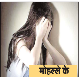
मोहल्ले के युवक ने घर में घुसकर की ज्यादती, पुलिस ने दबोचा