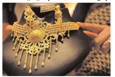
रियल इस्टेट, सराफा और ऑटोमोबाइल में रहा उठाव, बाजार में उमड़ी गौड़

कटनी। पुष्य नक्षत्र पर दमका बाजार दिवाली के पहले बरसा पैसा। गाड़ी, सोना चांदी, प्रॉपर्टी की खरीदी।