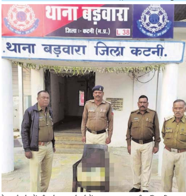
थाना बड़वारा जिला कटनी. थाना बड़वारा जिला कटनी.

डिलेवरी देने के पूर्व 60 वर्षीय वृद्ध दो किलो गांजा के साथ गिरफ्तार