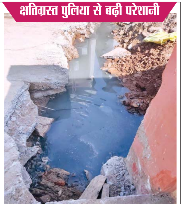
क्षतिग्रस्त पुलिया से बढ़ी परेशानी उपनगरीय क्षेत्र माधवनगर के आचार्य कृपालानी वार्ड स्थित केवल लाइन में डायमंड स्कूल के पास एक पुलिया बुरी तरह क्षतिग्रस्त हो गई है। इसके कारण यहां न केवल लोगों को आवागमन में परेशानी हो रही है बल्कि स्कूल होने के कारण छोटे-छोटे बच्चों के साथ किसी बड़ी दुर्घटना होने का भी अंदाजा बना हुआ है। क्षेत्रवासियों ने नगर निगम आयुक्त का ध्यान इस ओर आकर्षित करते हुए क्षतिग्रस्त पुलिया की मरम्मत कराए जाने की मांग की है।