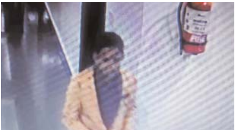
राघव रीजेंसी के कमरे से बाहर आते समय सीसीटीवी कैमरे में आई फोटो।

बताया जाता है कि तिलक समारोह की रस्मों को पूरा करने के बाद बघेल परिवार के सदस्य जब कमरे में पहुंचे तो वहां रखे 5 लाख रूपए नगद, सोने का जनेऊ, चांदी की थाली व चांदी की मछली गायब थी। जिसे किसी अज्ञात व्यक्ति ने तिलक समारोह में शामिल होकर पार कर दिया। चोरी गए सोने व चांदी के सामान की कीमत 5 से 10 लाख रूपए के लगभग बताई जा रही है। इस प्रकार चोरी की वारदात में लगभग 15 लाख रूपए कीमती