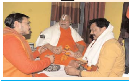
संत भी शामिल होंगे