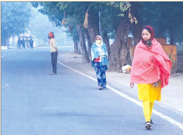
तापमान में और गिरावट आएगी और हवाओं के कारण सुबह-सुबह ओस की कड़ाके की टंड मसूस होगी। बर्फीली बूंदें बिछने लगी है। मौसम विभाग की माने

जबलपुर। उत्तरी-पूर्वी बर्फीली हवाएं अब तदुरन का अहसास कराने लगी है। सुबह-सुबह खुले क्षेत्रों में ओस के साथ कोहरा भी छाने लगा है। वातावरण में टंडक का अहसास अचानक बढ़ गया है। खमरिया, पिपरिया, परियट जैसे खुले क्षेत्रों में टंड ने सुबह-सुबह ऐसा जोर मारा कि वाहन चालक तदुरते दिखे। बर्फीली हवाएं अब चुभने लगी है। तापमान भी लगतार कम हो रहा है।