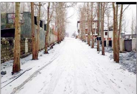
हिमाचल में भारी बर्फबारी से गिरा तापमान