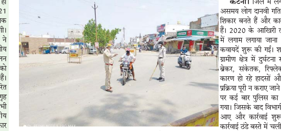
पन्ना नाका सिग्नल, कटाघोषाट मोड़ पर सिग्नल, मिशन चौक अंडरपास के नीचे की रोड का समतलीकरण, अग्रवाल कॉलोनी रोड को बनाने के लिए नगर निगम को पत्राचार किया गया है। इसके अलावा शहर के फुटपाथ पर जो मरमाने तरीके से दुकानें लग रही हैं उन पर रोक लगाने के लिए नगर निगम को यातायात पुलिस द्वारा पत्राचार किया गया है लेकिन अभी तक इस दिशा में कोई सांख्यिक पहल नहीं हुई है। पूर्व में यातायात प्रभारी लगातार कटनी जिले के समस्त ब्लैक स्पॉट्स का निरीक्षण किया गया था। दुर्घटनाओं के कारणों का पता लगाया और उन कमियों के दूर करने का प्रयास शुरू किए गए लेकिन संपूर्ण व्यवस्थाएं नहीं हुई हैं। उल्लेखनीय है कि पन्ना नाका में लगातार हादसे हो रहे हैं। हाल ही में बस एक्सिडेंट में एक युवक की मौत हो गई है।

ब्लॉक स्पॉटों में ब्रेकट- संकेतक लगाने की भी सिर्फ हुई है औपचारिकता कटनी। जिले में लगातार हादसे बढ़ रहे हैं। असमय लोग दानवी गति से भाग रहे वाहनों का शिकार बनते हैं और काल के गाल में समा रहे हैं। 2020 के आखिरी तक 50 फीसदी हादसों में लगाव लगाया जाना था। जिसके लिए कई कवायदें शुरू की गईं। शहर सहित उपनगरीय व ग्रामीण क्षेत्र में दुर्घटना संभावित क्षेत्रों में स्पीड ब्रेकर, संकेतक, रिफ्लेक्टर आदि न होने के कारण हो रहे हादसों और विभाग द्वारा यहां पर प्रक्रिया पूरी न कराए जाने को लेकर हो रहे हादसों पर कई बार पुलिस का ध्यान आकर्षित कराया गया। जिसके बाद विभागीय अधिकारी हरकत में आए और कार्रवाई शुरू की गई लेकिन फिर कार्रवाई ठंडे बस्ते में चली गई है। गौरतलब है कि पन्ना नाका सिग्नल, कटाघोषाट मोड़ पर सिग्नल, मिशन चौक अंडरपास के नीचे की रोड का समतलीकरण, अग्रवाल कॉलोनी रोड को बनाने के लिए नगर निगम को पत्राचार किया गया है। इसके अलावा शहर के फुटपाथ पर जो मरमाने तरीके से दुकानें लग रही हैं उन पर रोक लगाने के लिए नगर निगम को यातायात पुलिस द्वारा पत्राचार किया गया है लेकिन अभी तक इस दिशा में कोई सांख्यिक पहल नहीं हुई है। पूर्व में यातायात प्रभारी लगातार कटनी जिले के समस्त ब्लैक स्पॉट्स का निरीक्षण किया गया था। दुर्घटनाओं के कारणों का पता लगाया और उन कमियों के दूर करने का प्रयास शुरू किए गए लेकिन संपूर्ण व्यवस्थाएं नहीं हुई हैं। उल्लेखनीय है कि पन्ना नाका में लगातार हादसे हो रहे हैं। हाल ही में बस एक्सिडेंट में एक युवक की मौत हो गई है।