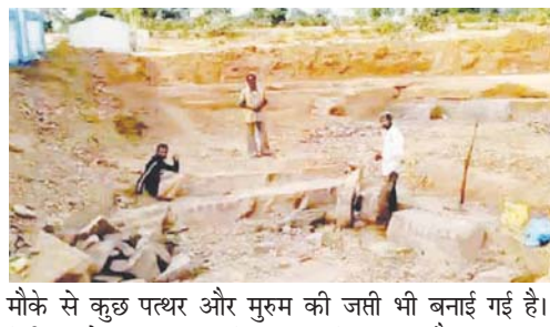
मौके से कुछ पत्थर और मुरुम की जमी भी बनाई गई है। निरीक्षण में पंचायत द्वारा बिना अनुमति पत्थर और मुरुम का उत्खनन किया जाना पाये जाने पर सरपंच और सचिव को कारण बताओ नोटिस जारी किया गया है। जवाब सन्तुष्टजनक नहीं पाये जाने पर संबंधितों के विरुद्ध नियमानुसार कार्रवाई की जाएगी।