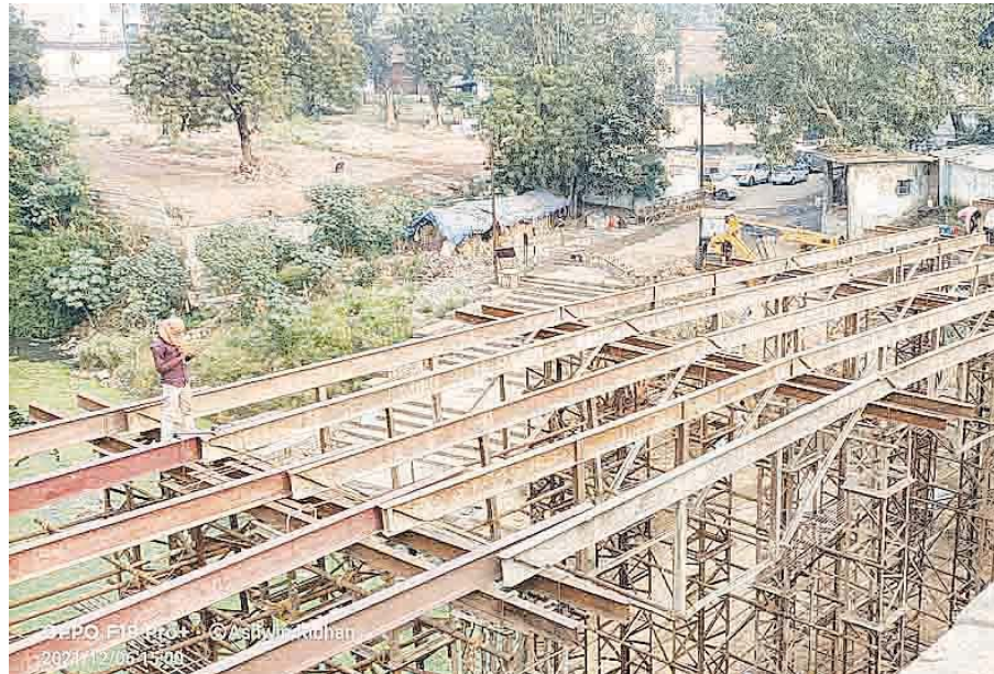
ठेकेदार ने दूसरे सिरे पर शुरू किया काम, लोगों को मिलेगी जाम से मुक्ति

चंडिका नगर के नागरिकों ने बताया कि सबसे ज्यादा परेशानी बरसात के दिनों में होती है। बारिश के मौसम में सड़क पर कीचड़ का साग्राज्य हो जाता है। जिसकी वजह से आवागमन कष्टदायक हो जाता है। इसी मार्ग से स्कूल के छात्र निकलते हैं। कीचड़ होने की वजह से कई बार उनके कपड़े भी खराब हो जाते हैं। सड़क में गड्ढे भी बने हुए हैं, जिससे आवागमन के दौरान लोग दुर्घटना का भी शिकार होते हैं। इसके अलावा बरसात के मौसम में जीव-जंतुओं का भी खतरा बना रहता है। इसी क्षेत्र से कोहारी नदी होकर गुजरी है। नदी में पानी बढ़ने पर चंडिका नगर में घुस जाता है, जिससे लोग परेशान होते हैं।