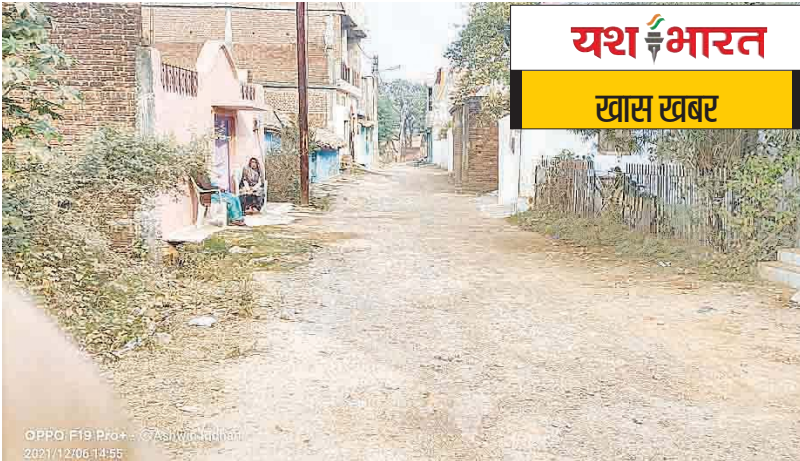
यशभारत खास खबर

शहर की आबादी बढ़ने के साथ ही आसपास के क्षेत्रों में जब बसाहट शुरू हुई तो उपनगरीय क्षेत्र कुठला के अंतर्गत आने वाले चंडिका नगर क्षेत्र में भी लोगों ने अपना रहवास बनाया। यहां बड़ी संख्या में लोगों ने जमीनें खरीदकर भवनों का निर्माण कराया और निवास करने लगे। चंडिका नगर क्षेत्र में मां चंडिका का प्रसिद्ध मंदिर भी स्थित है, जहां हर साल चैत्र और शारदेय नवरात्रि के अवसर पर विशाल धार्मिक आयोजन होता है, जिसमें पूरे क्षेत्र के साथ ही आसपास के अलाके से भी बड़ी संख्या में लोग इन आयोजनों में शामिल होकर पुण्यलाभ अर्जित करते हैं। इस क्षेत्र का नाम मां चंडिका के नाम पर ही रखा गया है। मंदिर का निर्माण होने के बाद नगर निगम प्रशासन द्वारा करीब दस साल पहले मंदिर परिसर तक पक्की सड़क का निर्माण कराया गया, जिससे क्षेत्र के लोगों को सुविधा मिली।