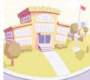
ऑफलाइन की बजाए ऑनलाइन क्लास शुरू करने की मांग की अभिभावक जन कल्याण संघ ने