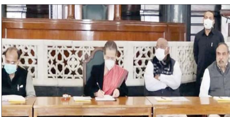
निर्लेन पर भी सरकार को खूब सुनाया। उन्होंने कहा कि सरकार का यह कदम

नई दिल्ली। कांग्रेस की अंतरिम अध्यक्ष सोनिया गांधी ने बुधवार को पार्टी की संसदीय दल की मीटिंग में मोदी सरकार पर हमला बोला। उन्होंने किसानों के आंदोलन, सीमा की सुरक्षा और विनिवेश के मुद्दे को उठाते हुए मोदी सरकार को घेरा। उन्होंने सीमा सुरक्षा को लेकर कहा कि सरकार को इस मुद्दे पर संसद में विस्तृत चर्चा करना चाहिए। सोनिया गांधी ने कहा कि देश में महंगाई चरम पर है और लोग अब बदलाव चाहते हैं। एक तरफ सरकार देश की संपत्ति को बेच रही है तो वहीं दूसरी तरफ आम लोग महंगाई से त्रस्त हैं। सोनिया गांधी ने राज्यसभा से 12 संसदों के