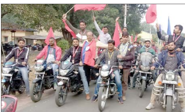
शक्ति प्रदर्शन के साथ चुनाव प्रचार समाप्त