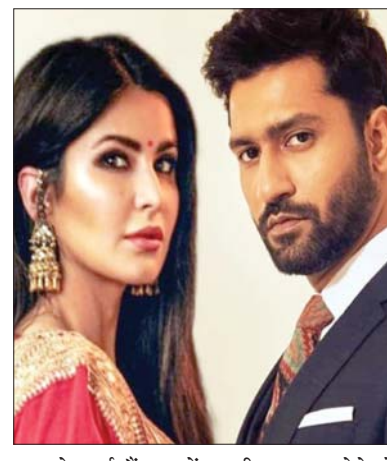
सामने आई हैं। इसमें कटरीना लाल जोड़े में

सवाई माधोपुर। विकी-कटरीना ने गुरुवार को शाम सात फेरे ले लिए। सवाई माधोपुर के बरवाड़ा फोर्ट में यह हाईप्रोफाइल शादी सम्पन्न हो गई। कटरीना कैफ और विकी कोशल ने शादी के बाद अपने फोटोज भी शेयर किए। इसके साथ कटरीना ने लिखा, हमारे दिलों में बसा एक दूसरे के लिए प्यार और सम्मान आज यहां तक ले आया। हमारी नई जिंदगी के लिए आप लोगों का प्यार और आशीर्वाद की जरूरत है। इसके पहले दो दिन तक उनका प्री-वेडिंग फंक्शन चला। बरवाड़ा फोर्ट में मंडप सजाया गया था। गुरुवार सुबह दिल्ली से फूल मंगाए गए थे। शादी के बाद विकी-कटरीना ने फोर्ट के बाहर मौजूद अपने फेंस के लिए मिठाइयां और केक भेजा। बाहर मौजूद ग्रामीणों ने शादी की बधाई दी। विकी-कटरीना की कुछ फोटो भी