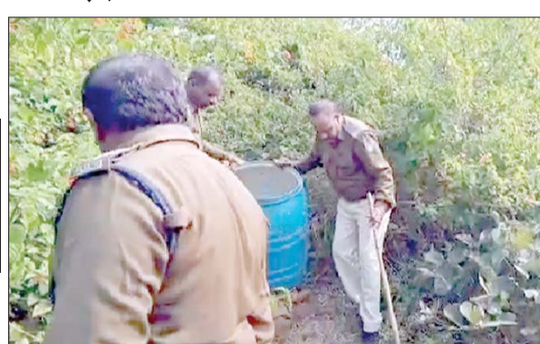
आबकारी की टीम द्वारा कच्ची शराब को नष्ट किया गया

जबलपुर, यशभारत। भेड़ाघाट के छतरपुर, सिलुआ में लोग उस समय हैरान हो गए जब आबकारी की टीम ने दबिश देते हुए 20 ड्रम कच्ची दारु और महुआ को गड़दों में भर दिया। आबकारी की इस दबिश को लेकर खूब चर्चाएं हुईं। लोगों ने सराहना की।