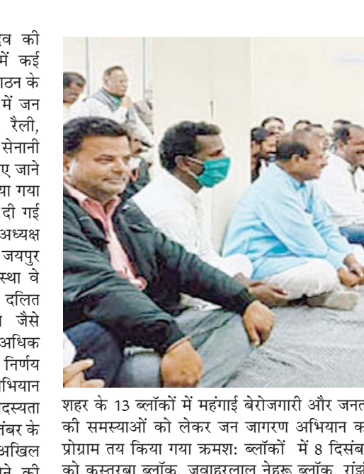
शहर के 13 ब्लॉकों में महंगाई बेरोजगारी और जनता की समस्याओं को लेकर जन जागरण अभियान का प्रोग्राम तय किया गया क्रमशः ब्लॉकों में 8 दिसंबर को कस्तूरबा ब्लॉक, जवाहरलाल नेहरू ब्लॉक, रांडी ब्लॉक, जाकिर हुसेन ब्लॉक। 9 दिसंबर को कमला नेहरू ब्लॉक, इंदिरा गांधी ब्लॉक, कैंट ब्लॉक,