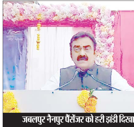
जबलपुर नैनपुर पैसेंजर को हरी झंडी दिखाकर सांसद ने रवाना किया।