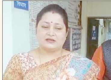
दूसरा डोज नहीं लगा और प्रमाण पत्र मिल गया जानकारी देती हुई महिला

जबलपुर, यशभारत। प्रदेश में चल रहे कोरोना वैक्सिनेशन में फर्जी आंकड़े प्रस्तुत कर, सौ फीसदी वैक्सिनेशन का लक्ष्य प्राप्त करने अधिकारी आमदा है। जिसका एक मामला परसवाड़ा प्राथमिक स्वास्थ्य केंद्र में उस समय सामने आया जब राष्ट्रीय विकास संगठन मध्य प्रदेश की प्रदेश अध्यक्ष सेंकेंड डोज का सर्टीफिकेट लेकर, सेंकेंड डोज लगवाने पहुंची। जिसके बाद अधिकारी एक दूसरे का मुंह तांकेते रह गए। जिसके बाद लगता है कि दाल में कुछ काला नहीं बल्कि पूरी की पूरी दाल ही काली है।