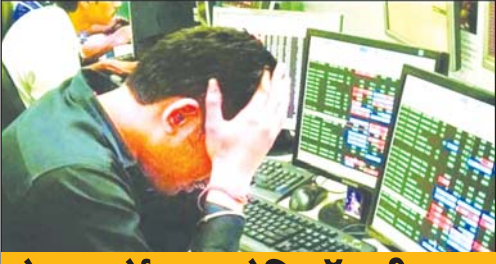
शेयर मार्केट पर ओमिक्रॉन की नजर

● वर्ष- 15 अंक 313 ● कटनी ● सोमवार, 20 दिसम्बर, 2021 ● मूल्य- 2 रुपए ● पृष्ठ- 8 ● पौष कृष्ण पक्ष-प्रतिपदा ● विक्रम संवत् 2078 शके 1935