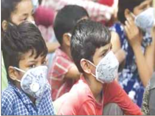
24 घंटे में 1.66 लाख नए मरीज

नई दिल्ली। देश में कोरोना की रफ्तार थोड़ी धीमी पड़ी है। पिछले चार दिनों से नए संक्रमण की वृद्धि दर में गिरावट का रुझान है। रविवार और सोमवार को यह 12.5 फीसदी पर स्थिर रही है। स्वास्थ्य विशेषज्ञों का मानना है कि दूसरे देशों के अनुभवों के आधार पर यह संभावना है कि आने वाले दिनों में धीरे-धीरे आंकड़ों में स्थिरता आएगी, लेकिन नए मामलों की संख्या बढ़ेगी। आठ से दस दिनों के बाद नए संक्रमणों में वास्तविक कमी का रुझान नजर आ सकता है।