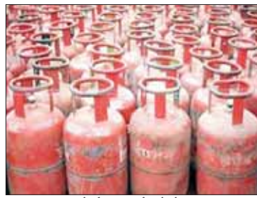
आइए जानते हैं क्या है प्रोसेस

जबलपुर। गैस सिलेंडर ग्राहकों के लिए खुशखबरी है। एलपीजी गैस सिलेंडर के लिए उपभोक्ताओं को फिर से सब्सिडी दी जा रही है। सब्सिडी का पैसा ग्राहक के खाते में ट्रांसफर कर दिया गया है हालांकि कुछ ग्राहकों को 158.52 रुपये या 237.78 रुपये (एलपीजी सब्सिडी) मिल रही है। इसके चलते अभी भी असमंजस की स्थिति बनी हुई है। बता दें कि पिछले कुछ दिनों से ऐसी घटनाएं हुई हैं जहां ग्राहकों के खातों में सब्सिडी नहीं दी जा रही है। लेकिन अब शिक्षायात आना बंद हो गई हैं। आपको बता दें कि गैस सब्सिडी के पैसे चेक करने के दो तरीके हैं। पहला पंजीकृत मोबाइल नंबर के माध्यम से और दूसरा एलपीजी आईडी के माध्यम से जो आपको गैस पासबुक में उल्लेखित है।