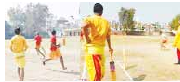
20 जनवरी तक चलेगा मैच

वैदिक कर्मकांडी ब्राह्मणों के क्रिकेट मैच 20 जनवरी तक चलेंगे। 12 टीमों क्रिकेट खेलेंगे। सोपहर 12 से शाम पांच बजे तक एक दिन में चार मैच होंगे। 10-10 ओवर के मैच रहेंगे। इसमें दो टीमों के 11-11 ब्रह्मण मैच खेलेंगे। विजेता टीम को 11 हजार रुपये का पुरस्कार मिलेगा। वहीं उपविजेता टीम को 5100 रुपये पुरस्कार राशि मिलेगी। विजेता व उपविजेता टीम के खिलाड़ियों को वैदिक पाठ की पुस्तक व पंचांग भी वितरण किए जाएंगे।