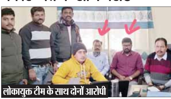
लोकायुक्त टीम के साथ दोनों आरोपी