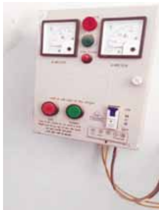
उपभोक्ता के घर में लगा सबमर्सिबल पंप, जो लो वोल्टेज की वजह से स्टार्ट नहीं हो रहा।