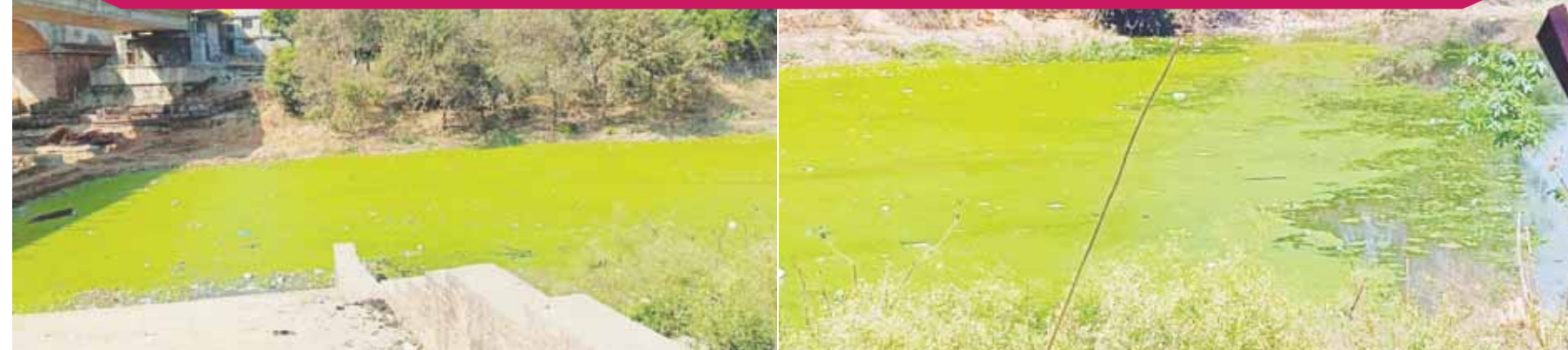
शहर की जीवनदायिनी कटनी नदी अपने अस्तित्व से जूझ रही है। कटनी नदी के गटरघाट, मोहनघाट और मसुरहा घाट में नदी का पानी प्रदूषित हो गया है। यहां स्टापेडम पर चोई जमी हुई है। इसके बावजूद जिला प्रशासन और नगर निगम के अधिकारियों ने नदी की सफाई के प्रति ध्यान नहीं दिया जा रहा है।