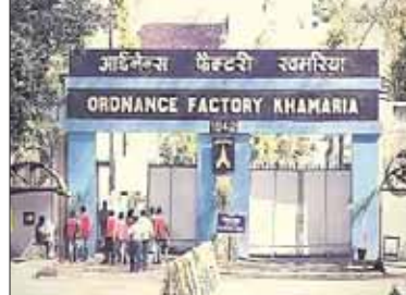
आपत्ति जताते हुए महाप्रबंधक को पत्र लिखा है। पत्र में कहा गया है कि विगत कुछ दिनों से सुरक्षा विभाग कभी भी किसी कर्मचारी पर

कभी पनीर तो कभी खिचड़ी बनाने का आरोप लगा कर प्रताड़ित कर कार्यवाही कर रहा है। वहीं प्रतिबंधित क्षेत्र डी बी एरिया में जिस अनुभाग में खतरनाक बारूद बनता है उसी बिल्डिंग के समीप तीन कर्मचारियों को रोगहाथ धूम्रपान करते पकड़े जाने के बाद तथाकथित नेताओं के हस्तक्षेप से मामला रफा दफा कर दिया गया है। वर्तमान समय में जब कम समय है उत्पादन तेज गति और सुचारू रूप से संचालित हो ताकि उत्पादन सत्र समाप्ति तक अधिकाधिक उत्पादन संभव हो सके लेकिन सुरक्षा विभाग की