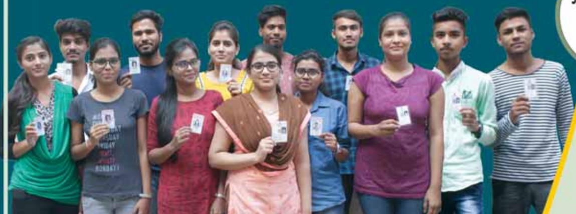
मध्यप्रदेश जनसम्पर्क द्वारा जारी

जिला मुख्यालय एवं मतदान केन्द्र स्तर पर भी राष्ट्रीय मतदाता दिवस का कार्यक्रम प्रातः 11 बजे से आयोजित