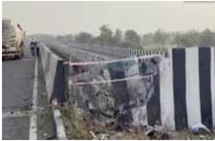
भाजपा विधायक विजय रहांगदले के बेटे की मौत महाराष्ट्र के वर्धा जिले में भीषण स?क हादसा हुआ है।

वर्धा। महाराष्ट्र के वर्धा जिले में कार हादसे में सात डट्टे छात्रों की दर्दनाक मौत हो गई है। मिली जानकारी के मुताबिक मरने वालों में भाजपा विधायक का बेटा भी शामिल है। सभी डट्टे छात्र परीक्षा खत्म होने के बाद कार से खाना खाने के लिए होटल में गए थे और वापसी में कार हादसे का शिकार हो गई और नदी में गिर गई। सातों एमबीबीएस छात्रों की घटनास्थल पर ही मौत हो गई। इस बीच पीएम मोदी ने महाराष्ट्र के सेलसुरा के पास दुर्घटना में जान गंवाने वालों के परिजनों को प्रधानमंत्री राश्री राहत कोष से 2-2 लाख रुपये और घायलों को 50,000 रुपये की अनुग्रह राशि देने की घोषणा की। प्रधानमंत्री कार्यालय ने यह जानकारी दी है।