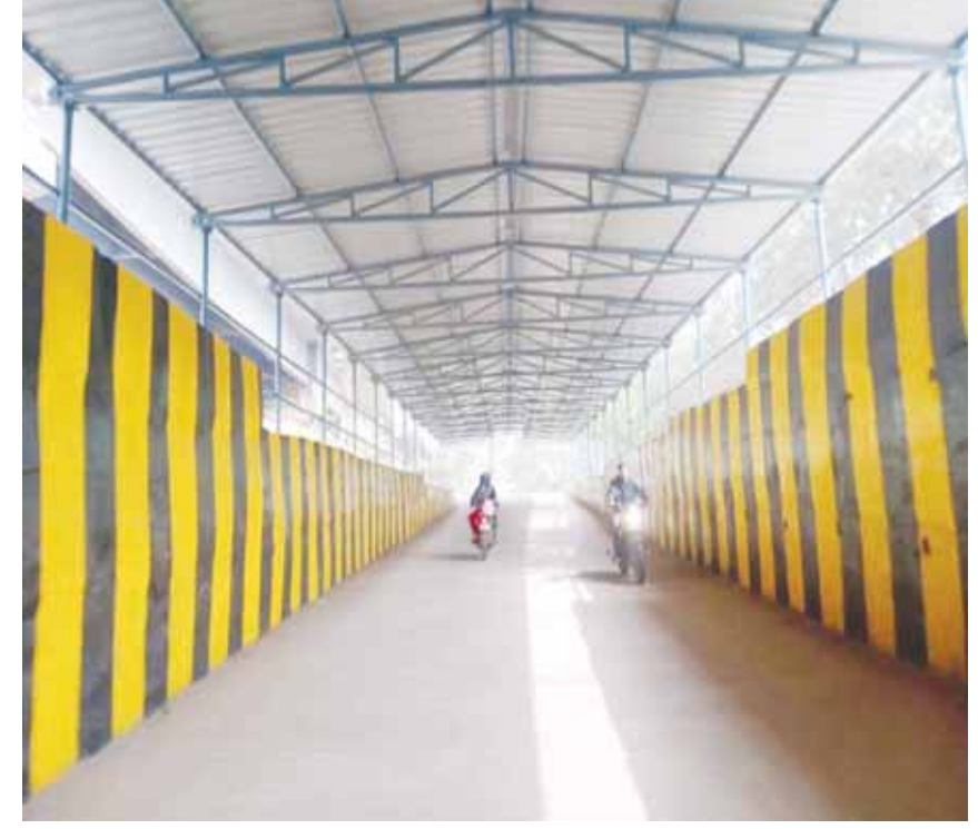
कटनी। खिरहनी फाटक अंडर ब्रिज के नीचे शेंड का काम पूरा हो गया है। शेंड लग जाने के बाद अब यहां से निकलने वाले राहगीरों को बरसात और गर्मी में पड़ने वाली तेज धूप से राहत मिलेगी।