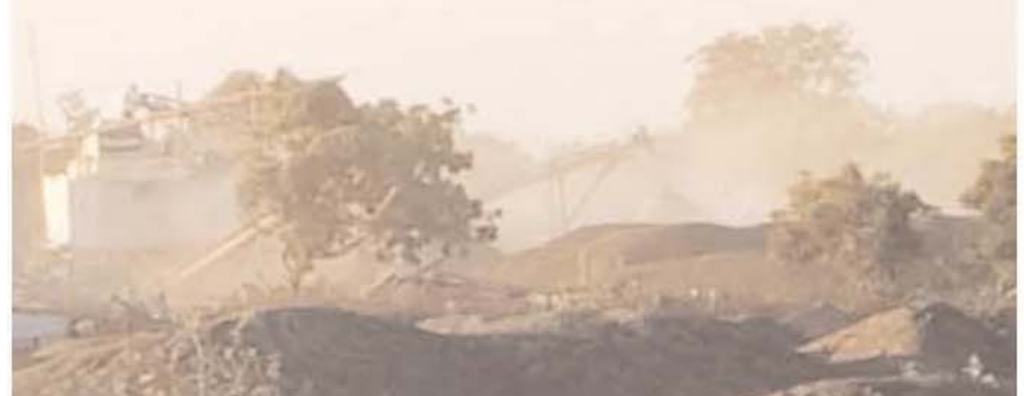
बरही तहसील के ग्राम कनौर, बिचपुरा, जाजागढ़, ददरा में संचालित है दर्जनभर क्रशर प्लांट

धूल के गुब्बार के आगोश में कनौर, जाजागढ़, बिचपुरा, खासी, दमा की बीमारी से ग्रसित हो रहे ग्रामीण, नियम-कानून को धूल में मिला रहे क्रशर संचालक