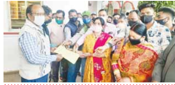
चरण बद्ध आंदोलन करने बलाई रूपरेखा, ज्ञापन सौपा