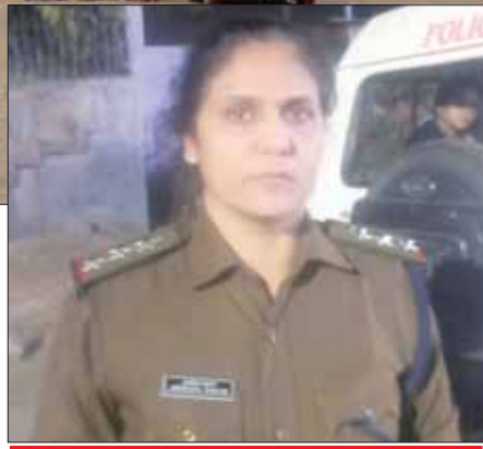
क्षेत्रीय लोगों में दिखा आक्रोश

लेकिन यहां जानकर हैरानी होगी कि थाना प्रभारी ने बीते दिनों मंडवा बस्ती में हुए 307 प्रकरणों का निपटारा और आरोपियों को पकड़ने में सफलता प्राप्त की थी जिसको लेकर एसपी ने बधाई भी दी थी। साथ ही 420 के प्रकरणों को निपटाने में गत दिवस थाना प्रभारी को 500 रूपए का इनाम भी दिया गया था। इसके बाबजूद थाना प्रभारी को लापरवाही मानकर लाइन अटैच की कार्रवाई की गई। जिसको लेकर पुलिस विभाग में तरह-तरह की चर्चाएं हो रही हैं। इस कार्यवाही से जनता भी हैरान हैं कि आखिर लाइन अटैच क्यों किया। उनकी कार्यप्रणाली से जनता में अप्रिय तत्वों का भय कम हो गया था। जुआ, सटा खिलाने वाले भाग खड़े हो गए थे