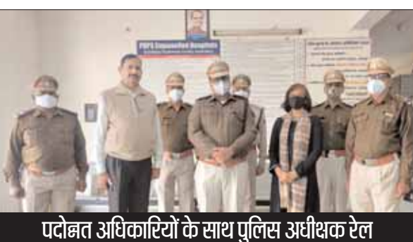
पदोन्नत अधिकारियों के साथ पुलिस अधीक्षक रेल