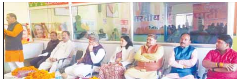
जिला अध्यक्ष ने किया स्वागत