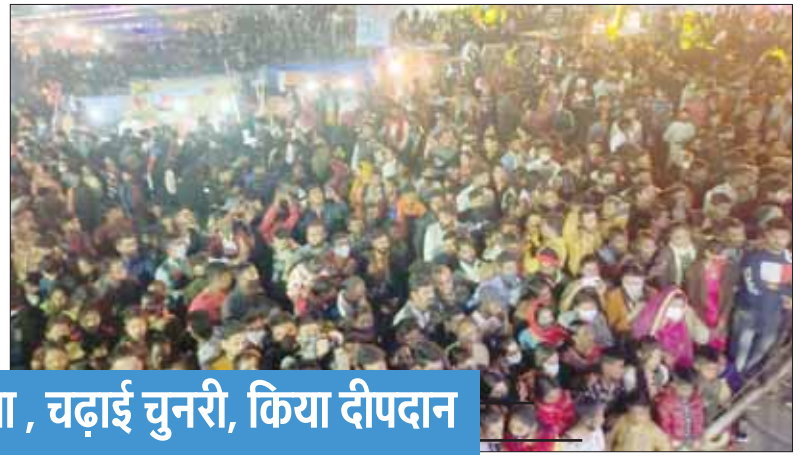
कोरोना पर भारी दिखी आस्था, चढ़ाई चुनरी, किया दीपदान