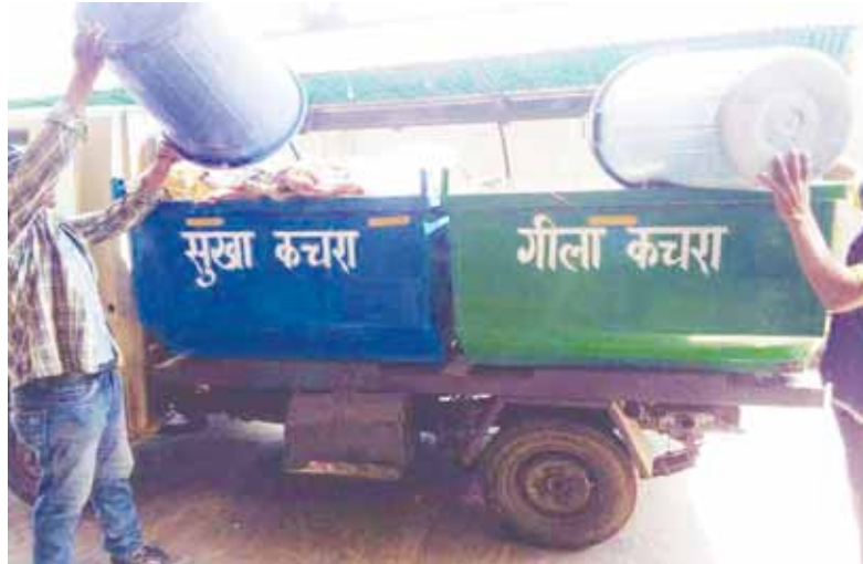
मुताबिक घरों से सूखा और गीला कचरा अलग-अलग लेने के लिए कचरा गाड़ी में अलग-अलग 2 कम्पार्टमेंट भी बनाए गए हैं, लेकिन घरों से कचरा लेते समय इस बात का ध्यान नहीं रखा जा रहा है। यह भी जानकारी मिली है कि दुगाड़ी नाला में जब गाड़ी शहर का कचरा लेकर पहुंचती है तो यहां गीला और सूखा कचरा अलग-अलग रखने का कोई इंतजाम नहीं किया गया है। जिससे स्वच्छता अभियान के दावों की पोल खुल रही है।

कटनी। शहर में एक तरफ स्वच्छता अभियान संचालित हो रहा है, तो वहीं दूसरी ओर घरों से गीला और सूखा कचरा अलग-अलग लेने की मुहिम फेल होती दिख रही है। नगर निगम द्वारा चलाई जा रही जागरूकता मुहिम का भी कोई असर होता नहीं दिख रहा है। इस पूरे मामले में एमएसडब्ल्यू कंपनी के जिम्मेदार अफसरों के साथ ही नगर निगम की भी लापरवाही सामने आ रही है।