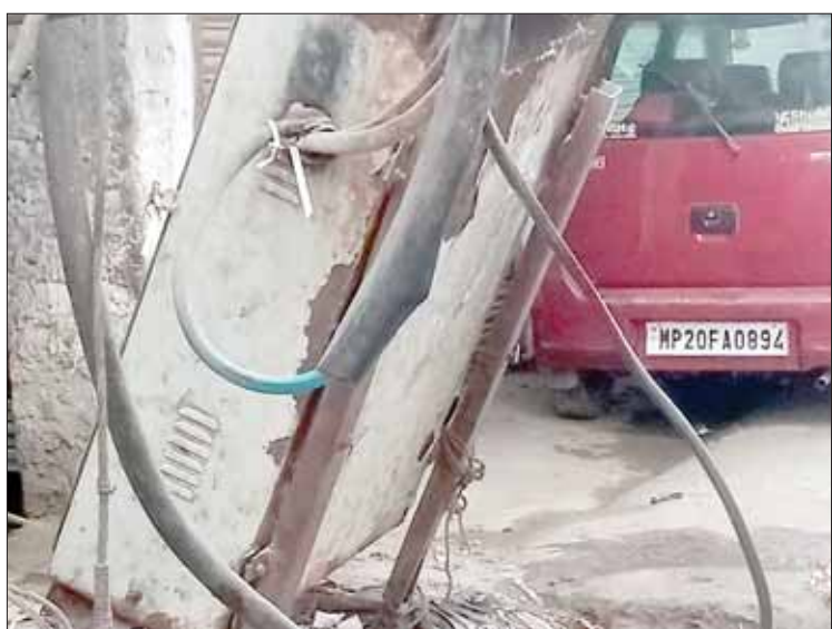
बताया जाता है कि विगत दिवस सुभाष टाकीज के पास लगे डीपी बाक्स के आसपास कचरा फेंकने की वजह से

जबलपुर,। मेंटेंनेंस के नाम पर हर साल लाखों रुपये बिजली विभाग खर्च करता है लेकिन कई जगह अब भी ट्रांसफार्मर के बाक्स पूरी तरह जर्जर हो चुके हैं। जिन्हें शिकायत करने के बाद भी बदला नहीं जा रहा है। मामला पुरानी सुभाष टाकीज हनुमानताल का है यहां पूरी तरह से टूटे-फूटे इस वितरण केंद्र से कई घरों में बिजली सप्लाई भेजी जा रही है। जिस तरह से इसकी हालत है इसकी वजह से कई जानवर करंट के झटके खाकर घायल हो चुके हैं। इस संबंध में स्थानीय लोगों ने बिजली कंपनी से लेकर जनप्रतिनिधियों तक को शिकायत की हुई है लेकिन सुनवाई नहीं हुई है।