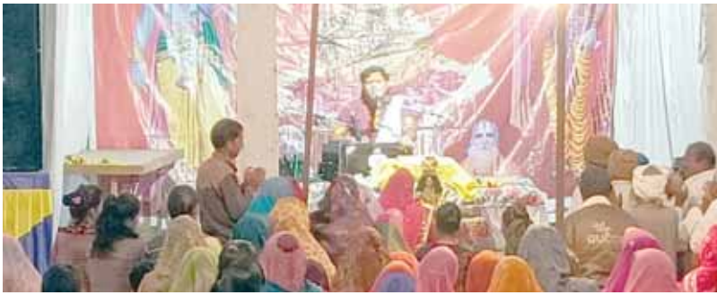
जो 16 फरवरी तक चलेगा जिसमें आप सभी श्रद्धालु भक्तजन यज्ञ स्थल पहुंचकर पुण्य लाभ अर्जित करें।