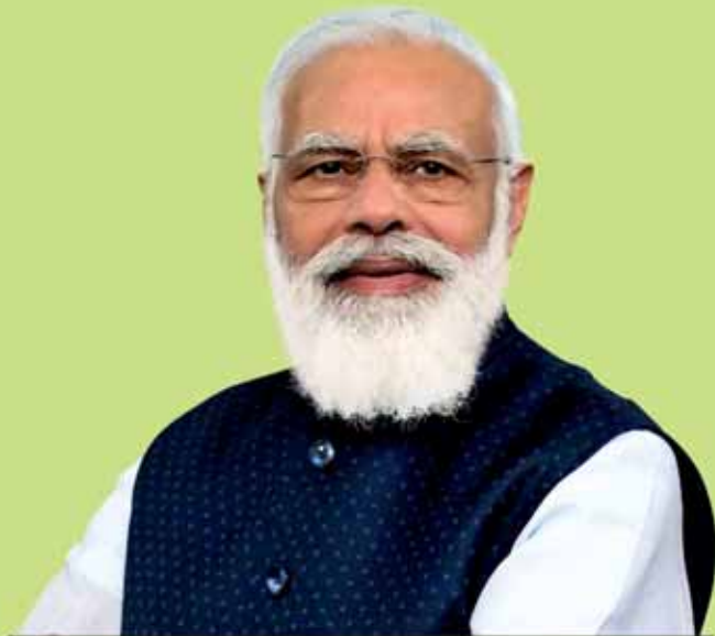
श्री नरेन्द्र मोदी प्रधानमंत्री