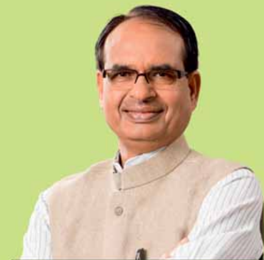
श्री शिवराज सिंह चौहान मुख्यमंत्री, मध्यप्रदेश