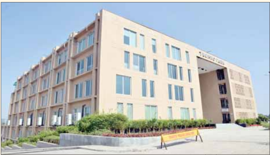
परिवहन की बेहतर कनेक्टिविटी की वजह से यहां कच्चे माल को लाने और तैयार माल को बाहर

भेजने की तमाम सुविधा मौजूद है। इसका अंदाजा इसी से लगाया जा सकता है कि 83 एकड़ में फैले आईटी पार्क में पहले चरण में से 63 एकड़ में भूमि आवंटित हो चुकी थी वहीं दूसरे चरण के लिए भी भूमि आवंटित की जा चुकी है। आईटी पार्क में निवेश बढ़े इसके लिए आईटी पार्क के निवेशकों के व्यापार को प्रोत्साहित करने एवं रोजगार के नए अवसर खोलने की दिशा में निगम प्रशासक एवं संभागवायुक्त बी चंद्रशेखर और निगमायुक्त अशीष चशिश के पहल आईटी पार्क में भवन निर्माण करने वालों से भवन अनुज्ञा शुल्क नहीं लेने का निर्णय लिया है। संभागवायुक्त ने कहा कि नगर निगम निर्माण कार्य करने वालों से नहीं लिया जाएगा मलबा शुल्क आईटी पार्क के निवेशकों को नहीं देना होगा जल शुल्क एवं विकास अथवा रखरखाव शुल्क वाटर हार्वेस्टिंग का स्ट्रक्चर बनाने के बाद निवेशकों को लौटाई जाएगी नगर निगम में जमा सुरक्षा निधि।