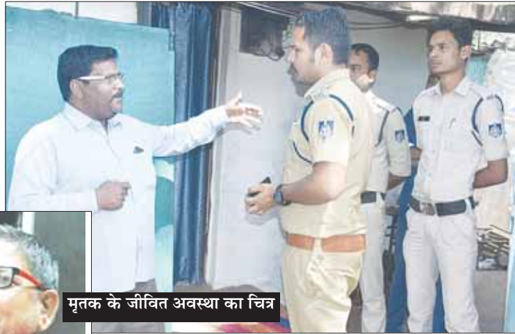
मृतक के जीवित अवस्था का चित्र