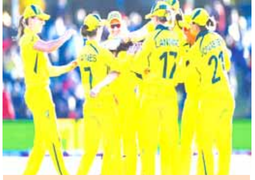
ICC Women's world cup, AUS vs ENG

क्राइस्टचर्च । आईसीसी महिला विश्व कप के खिताबी मुकाबले में टूर्नामेंट की दो सबसे सफल टीम ऑस्ट्रेलिया और इंग्लैंड एक-दूसरे के सामने हैं। क्राइस्टचर्च में जारी मैच में टॉस हारकर पहले बल्लेबाजी करते हुए ऑस्ट्रेलिया ने 356