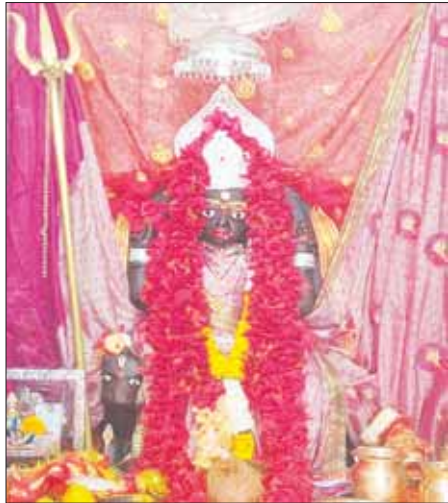
हे नवरात्रि के पावन पर्व पर रामकथा का आयोजन

नेशनल हाईवे क्रमांक 7 में जबलपुर से 65 किलोमीटर व जिला मुख्यालय सिवनी से 85 किलोमीटर दूर ग्रामीण आंचल में बसे नगर के लोगों की मान्यता के अनुसार धूमा की हृदय स्थल बाजार चौक में माता धूमावती का भव्य मंदिर है जो की पाँच मठों के दरबार से सजा हुआ है जिसमें दो दंत वाले विशाल काय गणेश भगवान की भव्य प्रतिमा, राधा कृष्ण, राम सीता, भोले नाथ विराजित हैं वहीं पूर्व में शीतला माता मंदिर जिसकी शीतल छाया से धूमा नगर फलीभूत है नगर के उत्तर में विराजमान खेरमाई व नौ देवी मंदिर व शंकर पार्वती मंदिर है जिसकी क्षेत्र में अद्वितीय सुंदरता का बखान देखते ही बनता है धूमा नगर के दक्षिण में पूर्व कालिक मूंड वाले बड़े हनुमान जी का स्वरूप क्षेत्र में कहीं भी देखने को नहीं मिलता अपने आप को चारों तरफ से अनेकों अभिभूतियों से सुसजित धूमावती माता की कृपा स्थली धन्य धान से परिपूर्ण