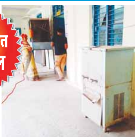
नगर निगम कार्यालय के प्रथम तल पर रखा वाटर कूलर, जो कि काफी समय से खराब है।

कटनी। शहर में व्याप्त पेयजल संकट से निपटने नगर निगम प्रशासन के उदासीन रवैए का अंदाजा इसी से लगाया जा सकता है कि नगर निगम कार्यालय में कुछ साल पहले 5 लाख रूपए की लागत से खरीदे गए वाटर कूलर के खराब होने के बाद उसे सुधरवाने की तरफ आज तक ध्यान नहीं दिया गया, जिसके चलते पूरे शहर को पेयजलापूर्ति करने वाले नगर निगम कार्यालय में ही पीने के पानी का इंतजाम नहीं है, जिसकी वजह से यहां काम करने वाले कर्मचारियों के साथ ही विभिन्न कामों को लेकर आने वाले लोगों को कई तरह की परेशानियों का सामना करना पड़ रहा है। जब नगर निगम कार्यालय के ये हाल हैं तो शहर के क्या होंगे, इसका अंदाजा आसानी से लगाया जा सकता है।