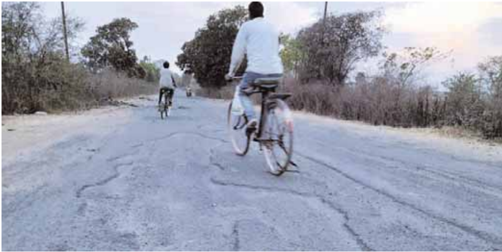
टोल नाका पर वसूली करने वाले ठेकेदार को मिला है ठेका

बरही। कटनी से बरही और बरही से पनपथा जनकपुर मार्ग की जर्जर सड़क का मेटेनेंस का ठेका हुआ। ठेकेदार ने वहीं-वहीं मेटेनेंस का लेप चढ़ाया। जहां भी सड़क की हालत ठीक थी, खस्ताहाल, जर्जर, गड्ढों में तब्दील हो चुके मार्ग को जस का तस छोड़ दिया गया। जिसे देखकर मार्ग का उपयोग कर रहे वाहन सवारों का आरोप है कि एमपीआरडीसी शहडोल डिवीजन का यह कैसा मेटेनेंस का ठेका है कि ठेकेदार ने वहीं लेप चढ़ाया जहां-जहां सड़क ठीक थी और जर्जर सड़क को उसी हालत में छोड़ दिया गया जबकि मेटेनेंस जर्जर सड़क का होना था। मेटेनेंस के नाम पर ठेकेदार ने एमपीआरडीसी के अधिकारियों से साठ-गांठ कर अधिक माल कमाने का लेप सड़क में लगा दिया। जिससे आज भी बरही-कटनी मार्ग का 70 फीसदी सड़क जर्जर अवस्था में है।