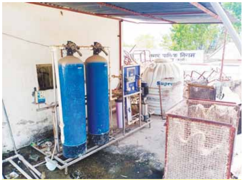
नगर निगम की छत पर लगा फिल्टर प्लांट, जो कि शो पीस बना हुआ है।