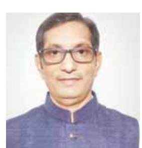
मार्च 2022 में परमे 79 प्रतिशत के साथ शीर्ष स्थान पर

जबलपुर यश भारत। भारतीय रेल पर वार्षिक रिपोर्ट के दौरान त्रैमासिक आंकलन के साथ केपीआई (की परफॉर्मंस इंडिकेटर) में अप्रैल से मार्च अवधि के दौरान की गई विभिन्न कार्यों में रेल राजस्व के मदों का आंकलन किया गया है। गौरतलब है कि पश्चिम मध्य रेल द्वारा वार्षिक रिपोर्ट के त्रैमासिक दत्तक के साथ माह जनवरी 2022 से मार्च 2022 तक केपीआई रिपोर्ट के अंतर्गत पुरे भारतीय रेलवे में शीर्ष स्थान पर है। *रेलवे बोर्ड द्वारा केपीआई रिपोर्ट के अंतर्गत विभिन्न परफॉर्मंस का इवैल्यूएशन का पैरामीटर निर्धारित है। *पश्चिम मध्य रेलवे में शीर्ष स्थान पर है। *परिचालन संबंधित माध्यम-इसके अंतर्गत ऑपरिजनेटिंग यात्री यातायात, ऑरिजनेटिंग फ्रेट लोडिंग, समयपालनता, औसत गति फ्रेट ट्रेन, डीजल लोको की उपयोगिता, इलेक्ट्रिक लोको की उपयोगिता एवं वैगनों की उपलब्धता सुनिश्चिती के साथ बेहतर प्रदर्शन किया गया है। संरक्षा प्रदर्शन-संरक्षा प्रदर्शन में बेहतर आंकलन के साथ शत प्रतिशत प्रदर्शन किया गया है। ट्रेक