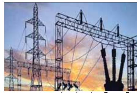
पावर प्लांट में कोयले की कमी

● वर्ष- 16 अंक 88-● जबलपुर ● शनिवार, 30 अप्रैल, 2022 ● मूल्य- 2 रुपए ● पृष्ठ- 8 ● वैशाख मास कृष्ण पक्ष-14 ● विक्रम संवत् 2079 शके 1935