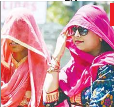
1 मई तक हीटवेव की संभावना है।

डुख के अनुसार, पश्चिम राजस्थान में 30 अप्रैल को हीटवेव की स्थिति और 1 मई को भीषण गर्मी की संभावना है। इसके अलावा विदर्भ, मध्य प्रदेश में अगले पांच दिनों के दौरान हीटवेव की संभावनाएं हैं। जबकि, पंजाब, हरियाणा-चंडीगढ़-दिल्ली, पश्चिम उत्तर प्रदेश, पूर्वी राजस्थान और तेलंगाना में ऐसे हालात चार दिनों के दौरान हो सकते हैं। बिहार, आंतरिक ओडिशा, गंगीय पश्चिम बंगाल, छत्तीसगढ़, गुजरात, मध्य महाराष्ट्र में आठ हीटवेव के आसार हैं। वहीं, पूर्वी उत्तर प्रदेश, झारखंड में