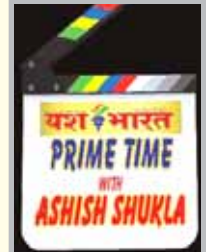
टीवीयो देखने के लिए यश भारत फेसबुक पर जाएं शाम 5 बजे प्रसारण

भाग दौड़ भरी जिंदगी में जैसे-जैसे समय आगे बढ़ता जा रहा है उसी प्रकार लोग अपने शरीर पर काम का भार ज्यादा डालने लगे हैं। इन सब चीजों में लोग अपने आपको काम में इस तरह व्यस्त कर लेते हैं कि उन्हें अपने स्वास्थ्य की भी चिंता नहीं रहती। लेकिन कई बार ज्यादा काम करना और सेहत पर ध्यान ना देने से स्वास्थ्य पर भी इसका बुरा प्रभाव पड़ सकता है और हम बीमारियों के शिकार हो जाते हैं। ऐसी ही