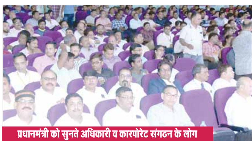
प्रधानमंत्री को सुनते अधिकारी व कारपोरेट संगठन के लोग