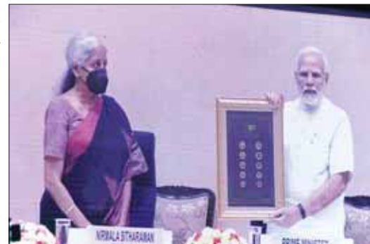
समर्थ एप का हुआ लोकार्पण

प्रधानमंत्री मोदी ने कहा कि ऋद्धशहृद्धय-यानि सुधार के साथ ही हमने जिस बात पर फोकस किया, वो है सरलीकरण। केंद्र और राज्य के अनेक टैक्सों के जाल की जगह अब जोएसटी ने ले ली है। इस सरलीकरण का नतीजा भी देश देख रहा है। अब हर महीने जोएसटी लेक्शन एक लाख करोड़ रुपये के पार जाना सामान्य बात हो गई है। बीते आठ वर्षों में देश ने जो सुधार किए हैं, उनमें बड़ी प्राथमिकता इस बात को भी दी गई है कि हमारे देश के युवाओं को अपना सामर्थ्य दिखाने का पूरा मौका मिले। हमारे युवा अपनी मनचाही कंपनी आसानी से खोल पाएं, वो अपने इंटरप्राइस आसानी से बना पाएं और उन्हें आसानी से चला पाएं। जबलपुर में कार्यक्रम के दौरान वीडियो कॉन्फ्रेंसिंग के माध्यम से देश की वित्त मंत्री निर्मला सीतारमण और वरिष्ठ अधिकारी जुड़े रहे साथ ही साथ जबलपुर के मानस भवन में भी बड़ी संख्या में अधिकारी मौजूद थे जिन्होंने प्रधानमंत्री के उद्बोधन को सुना।