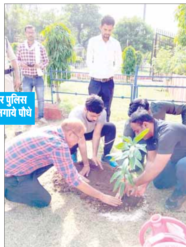
कलेक्टर, निगमायुक्त और पुलिस अधीक्षक ने नेहरू पार्क में लगाये पौधे