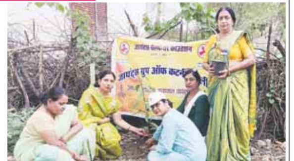
5 जून रविवार को विश्व पर्यावरण दिवस के अवसर पर जिले में जगह-जगह वृक्षारोपण अभियान चलाकर समाजसेवी संस्थाओं सहित अन्य संगठनों के द्वारा पौधे रोप कर संरक्षण का संकल्प लिया गया।