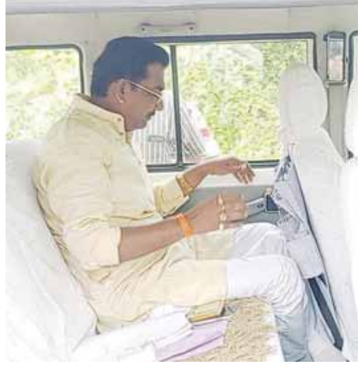
सरसवाही ग्राम पंचायत के पास घटना