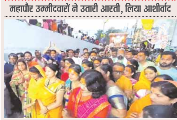
महापौर उम्मीदवारों ने उतारी आरती, लिया आशीर्वाद

रथयात्रा के पीछे देवी-देवताओं का स्वरूप लिए बच्चे और बड़े विराजे हुए थे। बैंड की धुन पर श्रद्धालु नृत्य कर रहे थे। रथयात्रा में जीवंत ज्ञाकियों आकर्षण का केंद्र रही। राधाकृष्ण व गोपियों के नृत्य ने लोगों का मन मोहा। अखाड़ों का हैरतअंगेज कर्तव्य देख लोग हतप्रभ रह गए। लोगों ने पुष्पवर्षा के साथ आरती की। श्रद्धालुओं में रथ खींचने की होड़ लगी रही। 5 बजे के लगभग शुरू हुई रथयात्रा देरात सच्ची मंडी स्थित मंदिर पहुंची।