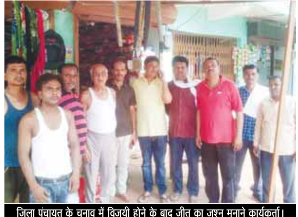
जिला पंचायत के चुनाव में विजयी होने के बाद जीत का जश्न मनाने कार्यकर्ता।

रथ यात्रा शुरू होते ही पूजन के लिए हंग मंडी। जगह-जगह लोगों ने भगवान की सुंदर आरती उतारकर महाआरती की। एक से बढ़कर एक भगवान को भोग अर्पित किए। इस दौरान सामाजिक संगठनों, व्यापारियों ने रथ यात्रा का भव्य स्वागत किया। रथ यात्रा में शामिल लोगों के लिए जलपान आदि की व्यवस्था की गई। रथ यात्रा में कौमी एकता की भी मिसाल भी दिखी। सभी धर्मों के लोग शामिल हुए। रथ यात्रा में भोग में भात का वितरण हुआ।