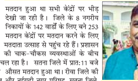
हंगामा जारी था। इस दौरान जौवाजीगंज स्थित मतदान केंद्र पर भी भाजपा और कांग्रेस कार्यकर्ताओं के बीच तनाव की स्थिति बन गई, हालांकि पुलिस बल ने भीड़ को खदेड़ दिया।