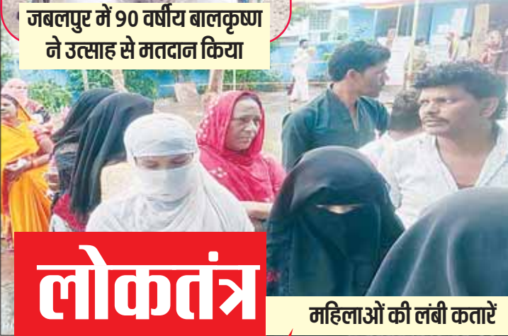
महिलाओं की लंबी कतारें