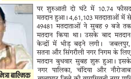
राज्यसभा सांसद सुमित्रा बालिक ने मतदान किया