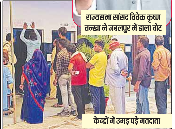
केंद्रों में उमड़ पड़े मतदाता