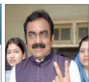
जबलपुर सांसद राकेश सिंह ने भी किया मतदाधिकार का प्रयोग