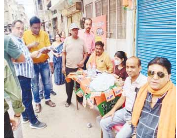
पोलिंग बूथ पर मतदाताओं की पर्वी का मिलान करते हुए भाजपा कार्यकर्ता।

मजेदार बात यह है कि इन अपीलों को कितने लोगों ने देखा इन पर क्या कमेंट आये तथा किसको कितने लाइक मिले इसे लेकर भी समर्थक अपने अपने दावे करते रहे। साधारण पोस्ट के अलावा लोगों ने फेसबुक पर पेसा देकर पोस्ट बूस्ट भी करवाए।