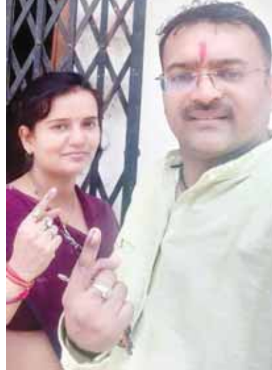
पति पत्नी ने एक साथ किया अपने मताधिकार का उपयोग।