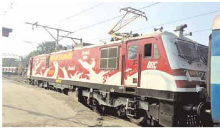
गौरतलब है कि वर्तमान में रेलवे गैर किराया राजस्व विचार योजना (एनआईएनएफआरआईएस) को कार्यान्वित करके गैर-किराया राजस्व (एनएफआर) के तहत स्टेशनों को अत्याधुनिक सुविधाओं को उपलब्ध कराने में अहम भूमिका इलेक्ट्रिक लोको शेड न्यू कटनी जंक्शन के इलेक्ट्रिक इंजनों पर विज्ञापन का अनुबंध प्रदान किया है। इस अनुबंध में 05 इलेक्ट्रिक इंजनों को विज्ञापन प्रदर्शित करने के लिए चुना गया है। इस विज्ञापन अनुबंध से रेलवे को प्रति लोकोमोटिव से 2 लाख रुपये दर से कुल 10 लाख रुपये प्रति वर्ष रेल राजस्व में वृद्धि होगी। यह अनुबंध प्रति लोकोमोटिव वार्षिक मूल्य के मामले में डिजीजन द्वारा दिया गया अब तक का सबसे अधिक कमाई वाला अनुबंध है। लोकोमोटिव विद्युत इंजनों पर आरडीएसओ विनिर्देशित मानकों के अनुसार अत्याधुनिक पीयू (पॉलीयूरेथेन) पेंटिंग के माध्यम नवीनतम किया जाएगा। रेलवे आगे भी आधुनिक सुविधाओं को बढ़ाने के लिए गैर-किराया राजस्व के तहत नई अभिनव गैर किराया राजस्व विचार योजना (एनआईएनएफआरआईएस) नीति के तहत अन्य मंडलों में भी नयी-नयी योजनाओं को फलीभूत करने के लिए कृतसंकल्पित है।

कटनी, यशभारत। पश्चिम मध्य रेलवे नई अभिनव गैर किराया राजस्व विचार योजना (एनआईएनएफआरआईएस) के तहत इलेक्ट्रिक लोको शेड न्यू कटनी जंक्शन के इलेक्ट्रिक इंजनों में विज्ञापन के जरिए अपनी आय में वृद्धि करने जा रहा है। इंजनों पर विज्ञापन के अनुबंध से प्रति वर्ष 10 लाख रुपये रेलवे को अतिरिक्त राजस्व प्राप्त होगा।