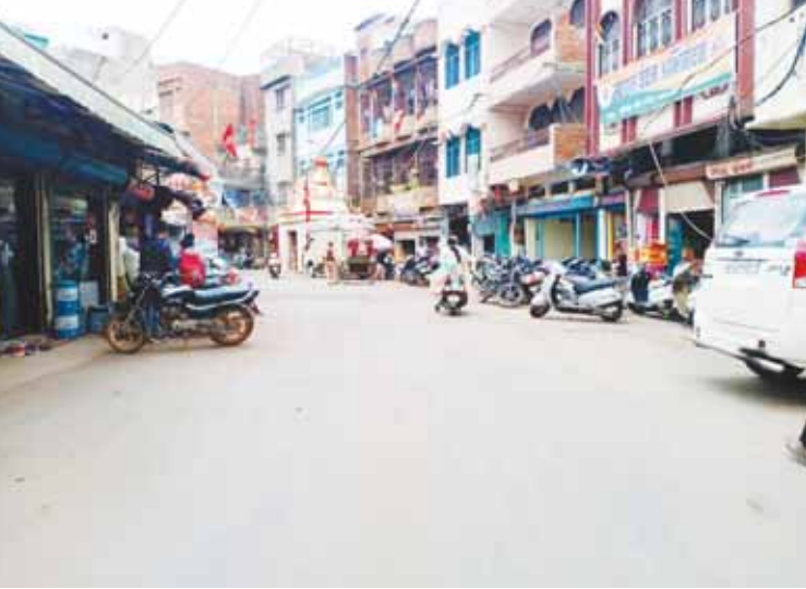
आज मतदान के दौरान दोपहर बाद शहर की सड़कों पर सन्नाटा पसरा रहा।

इधर मतदान की रात बेहद संवेदनशील रात रही। रात भर सायरन बजाती पुलिस की गाड़ियों की दौड़ लगती रही कहीं से शराब बंटने की खबर आई तो कहीं पर साड़ियों को बंटने से पहले पकड़ने का वीडियो वायरल होता रहा।