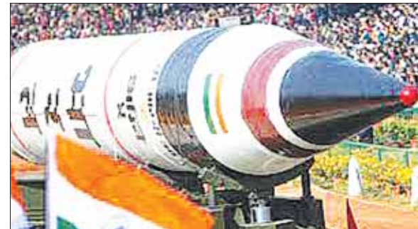
भारत ने चीन के खिलाफ बढ़ाया फोकस, बढ़ा रहा परमाणु ताकत

वॉशिंगटन, नई दिल्ली, एजेंसी। अमेरिकी वैज्ञानिकों की संस्था फेडरेशन ऑफ अमेरिकन साइंटिस्ट ने अपनी ताजा रिपोर्ट में खुलासा किया है कि भारत ने 140 से लेकर 210 परमाणु बम बनाने के लिए जरूरी सैन्य प्लूटोनियम पैदा कर लिया है। हालांकि भारत के पास अभी 160 परमाणु बम ही हैं। रिपोर्ट में कहा गया है कि भारत लगातार लंबी दूरी तक मार करने वाली मिसाइलें बना रहा है जिससे उसे जल्द ही नए परमाणु हथियारों की जरूरत होगी। यही नहीं भारत परमाणु बम को दागने के लिए 4 नए हथियार सिस्टम का भी निर्माण कर रहा है।