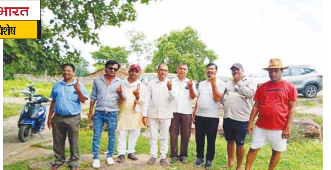
अमकुही में उत्साह के बीच मतदान हुआ। मतदान के बाद उंगली में रसाही दिखाकर जागरूकता का परिचय देते मतदाता।