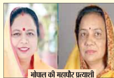
भोपाल की महापौर प्रत्याशी