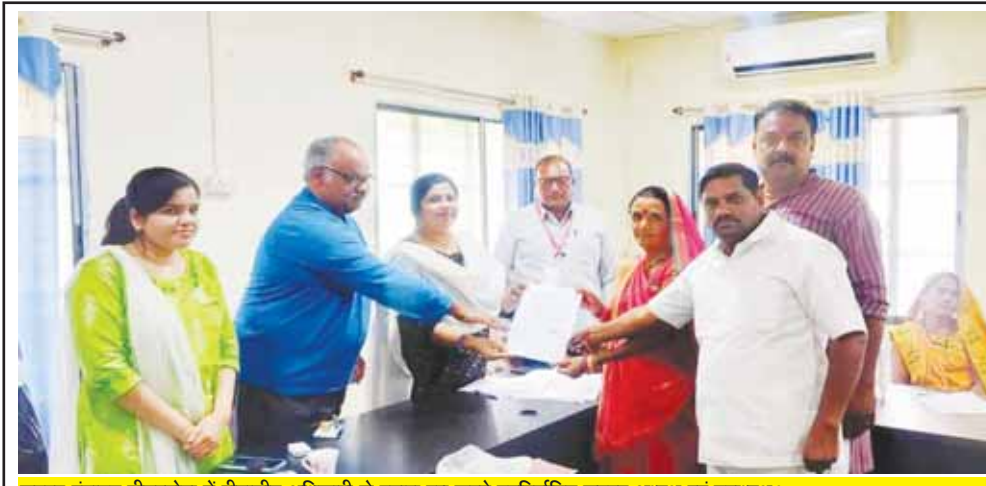
जनपद पंचायत दीमरखेड़ा में पीठासीन अधिकारी से प्रमाण पत्र करते नवनिर्वाचित जनपद अध्यक्ष एवं उपाध्यक्ष।