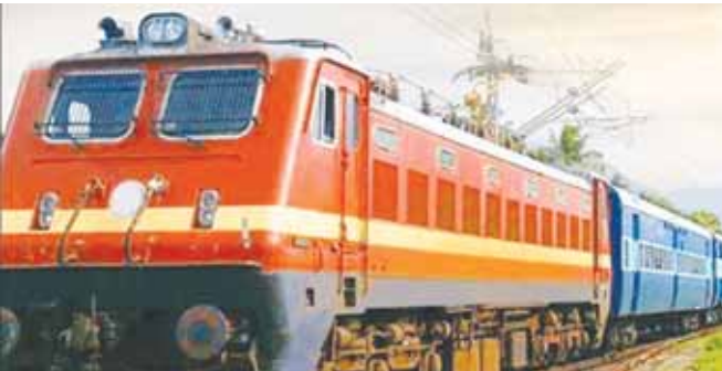
जबलपुर-सोमनाथ-जबलपुर एक्सप्रेस गाड़ी का दृश्य।

कटनी, यशभारत। पश्चिम रेलवे के अंतर्गत राजकोट मंडल के सुरेन्द्रनगर-राजकोट रेलखंड में स्थित थान स्टेशन पर दोहरीकरण कार्य के अंतर्गत इलेक्ट्रॉनिक इंटरलॉकिंग कार्य के लिए मेगा ब्लॉक किया जा रहा है। जिसके चलते इस रेलखंड की कुछ गाड़ियों को निरस्त, कुछ को आंशिक निरस्त और कुछ को परिवर्तित मार्ग से चलाने का निर्णय लिया गया है। आंशिक निरस्त होने वाली गाड़ियों में गाड़ी संख्या 11466/11465 जबलपुर-सोमनाथ-जबलपुर एक्सप्रेस भी शामिल है। मुख्यालय द्वारा जारी प्रेस विज्ञापित में बताया गया कि 29 जुलाई को अपने प्रारंभिक स्टेशन जबलपुर से चलने वाली गाड़ी संख्या 11466 जबलपुर-सोमनाथ एक्सप्रेस अहमदाबाद स्टेशन पर टर्मिनेट होगी। यह गाड़ी अहमदाबाद से सोमनाथ के बीच आंशिक रद्द रहेगी। इसी प्रकार वापसी में 30 जुलाई को अपने प्रारंभिक स्टेशन सोमनाथ से चलने वाली गाड़ी संख्या 11465 सोमनाथ की जगह अहमदाबाद स्टेशन से प्रारंभ होकर गन्तव्य के लिए प्रस्थान करेगी। यह गाड़ी सोमनाथ से अहमदाबाद के बीच आंशिक रद्द रहेगी।