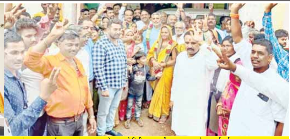
जनपद पंचायत बड़वारा में अध्यक्ष एवं उपाध्यक्ष पद के चुनाव में मिली शानदार जीत का जश्न मनाते हुए कार्यकर्ता।