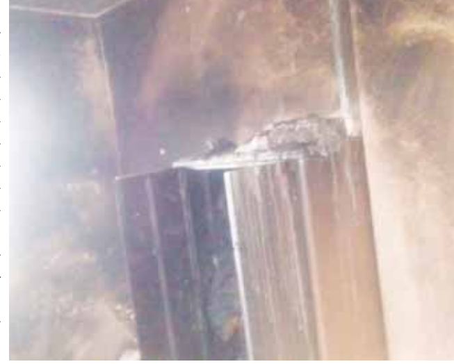
आग लगने का दृश्य।