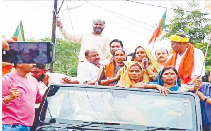
मनाया शुरू कर दिया।