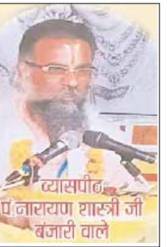
अगस्त 2022 दिन गुरुवार को रखा

सिवनी यशभारत। श्री हनुमान जी महाराज की कृपा से एवं श्री बंजारी माँ की सतप्रेरणा से श्री मद्भागवत कथा सप्ताह ज्ञान यज्ञ एवं महारुद्राभिषेक का दिव्य आयोजन दिनांक 29 जुलाई से 4 अगस्त 2022 तक स्थानीय राशि लान, बैंक ऑफ बड़ौदा के सामने बारापथर सिवनी में किया गया है। आयोजन समिति ने कार्यक्रम के संबंध में जानकारी देते हुए बताया कि कलाश शोभा यात्रा स्थापना 29 जुलाई 2022 दिन शुकवार तथा हवन पूर्णाहुती विसर्जन एवं भण्डारा 04 अगस्त 2022 दिन गुरुवार को रखा