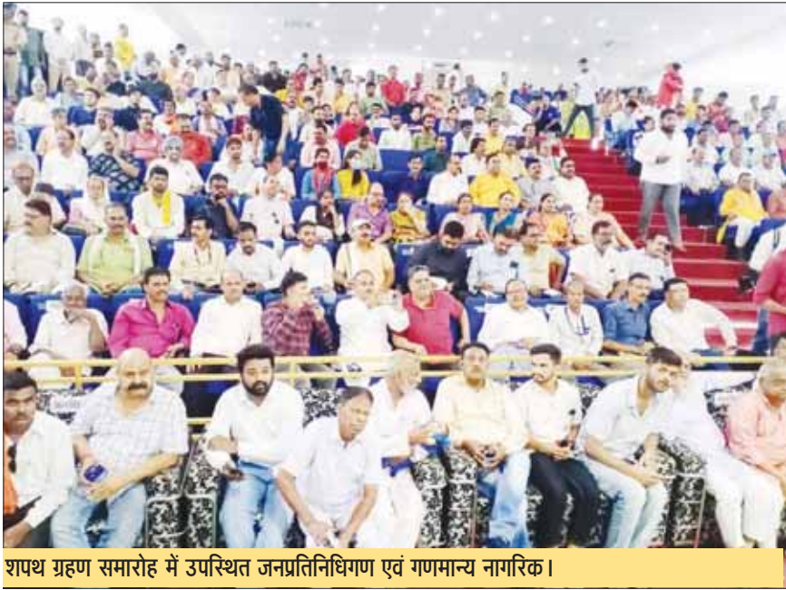
शपथ ग्रहण समारोह में उपस्थित जनप्रतिनिधिगण एवं गणमान्य नागरिक।

कलेक्टर प्रियंक मिश्रा ने कहा कि 6 जुलाई 1874 को नगर पालिका का गठन किया गया था। इस नई परिषद को अपने कार्यकाल के दौरान ऐतिहासिक अवसर मिल रहे हैं, जिसमें नवनिर्वाचित जनप्रतिनिधियों को गर्व की अनुभूति होगी, इसमें आजादी का अमृत महोत्सव एवं कटनी नगर के गठन के डेढ़ सौ साल पूरे होने का अवसर शामिल है। इस दौरान आने वाले 25 सालों को ध्यान में रखते हुए शहर हित में संकल्प लेकर कार्य करने का समय है। उन्होंने कहा कि अब आपको कसौटी पर उतारा जाएगा। जो वादे आप लोग करके आए हैं। अब हर दिन आपको परीक्षा की घड़ी से गुजरना होगा। यही जनतंत्र की खूबसूरती है कि चाहे इलेक्ट होकर आए या सिलेक्ट होकर आए, सभी को जनतांत्रिक मूल्यों की कसौटी से होकर गुजरना होता है। कलेक्टर ने कहा कि आज मुझे सबसे ज्यादा खुशी हो रही है, क्योंकि आज प्रशासक के रूप में मेरा कार्यकाल समाप्त हो गया। करीब डेढ़ सालों तक प्रशासक के रूप में काम करने के दौरान मुझे लगता है कि नगर निगम का संचालन जनतांत्रिक व्यवस्थाओं से ही होना चाहिए, इसके लिए एक निर्वाचित संस्था आसीन होना चाहिए। कटनी में देश का अग्रणी शहर बनने के सभी गुण हैं। कलेक्टर ने महापौर सहित सभी 45 पार्षदों को स्वर्णिम कार्यकाल के लिए शुभकामनाएं दीं।