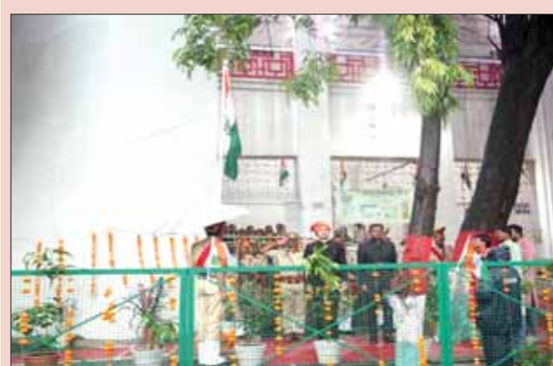
आजादी के रंग में रंगे मध्यप्रदेश के मंदिर और ऐतिहासिक स्थल, सरकारी भवनों में भी आकर्षक सजावट