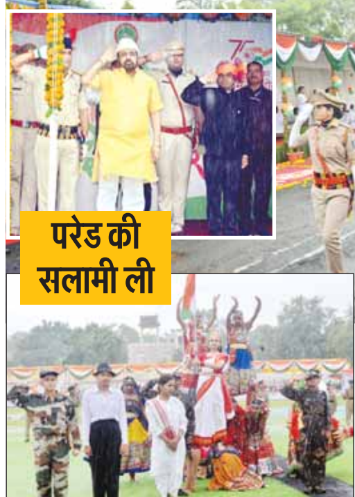
परेड की सलामी ली

आजादी के अमृत महोत्सव शान से लहराया तिरंगा व सांस्कृतिक कार्यक्रमों की धूम