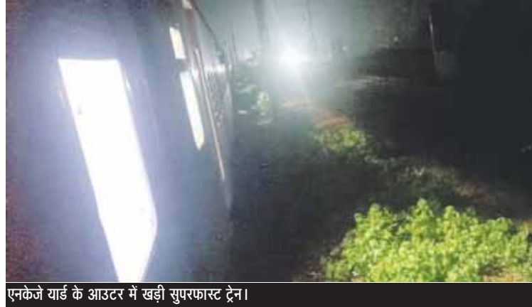
एनकेजे याई के आउटर में खड़ी सुपरफास्ट ट्रेन।

कटनी से शहडोल होते हुए बिलासपुर और बिलासपुर से शहडोल होते हुए कटनी की यात्रा करने वाले यात्रियों की पिछले करीब दो महीने से जमकर फजीहत हो रही है। इस रूट की ट्रेनों को स्टेशनों और आउटर पर रोककर एनकेजे याई से मालगाड़ियों को आगे बढ़ाया जा रहा है। यात्रियों का कहना है कि रेल प्रशासन द्वारा राजस्व बढ़ाने की तरफ ध्यान दिया जा रहा है, लेकिन मुसाफिरों की परेशानियों से कोई सरोकार नहीं है। ट्रेनों को कटनी जंक्शन, झलवारा रेलवे स्टेशन और एनकेजे हाल्ट सहित आउटर पर