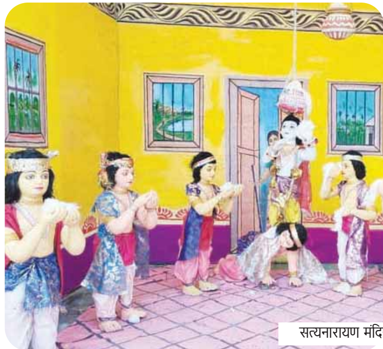
सत्यनारायण मंदिर में सजी झांकियां