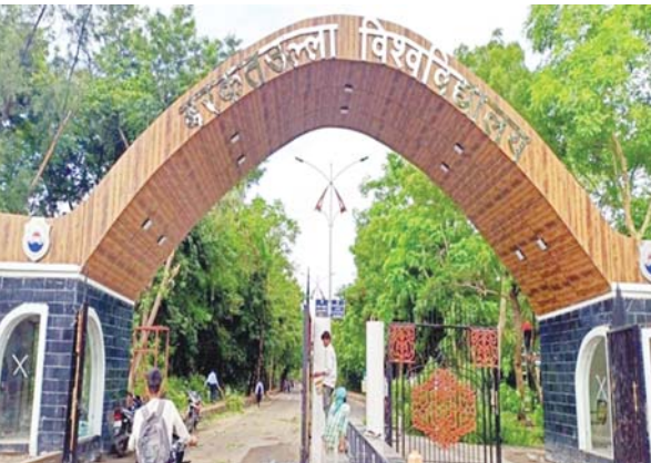
20 से अधिक कोर्स में जीरो प्रवेश

भोपाल, यशभारत। बरकतउल्ला विश्वविद्यालय (बीयू) को नेशनल असेसमेंट एंड एक्स्ट्रिडेशन काउंसिल (नैक) का बी-ग्रेड मिला है। विश्वविद्यालय प्रशासन ए-ग्रेड में आने के लिए तमाम प्रयास कर रहा है, लेकिन इस बार भी यह मुश्किल लग रहा है। बीयू में पांच से सात साल पहले शुरू किए गए कई कोर्स बंद हो गए और कई बंद होने के कारण पर है। 2014 में करोड़ों रुपये खर्च कर बायो साइंस विभाग में स्टेम सेल इंजीनियरिंग की स्थापना की गई। इस सेल की स्थापना इसलिए की गई, ताकि स्टेम सेल और टिशू इंजीनियरिंग का उपयोग करके बीमारियों के बारे में विद्यार्थी जान सकें, लेकिन इस सेल की स्थापना के बाद से स्टेम सेल इंजीनियरिंग में सिर्फ 18 विद्यार्थियों ने प्रवेश लिया था। इस कोर्स की शुरुआत की गई, लेकिन न तो फैकल्टी और न ही प्रयोग के लिए कोई सुविधाएं उपलब्ध थीं। इस कोर्स में प्रवेश लेने वाले विद्यार्थियों को दूसरे संस्था से किसी तरह कोर्स कराकर पास कराया गया। ऐसा ही हाल बायो मेडिकल व सायबर इन ला सहित अन्य कोर्स का रहा। इन कोर्स में एक भी विद्यार्थी नहीं मिलने के कारण बंद कर दिया गया। वहीं बीयू के 20 से अधिक डिप्लोमा कोर्स में तीन साल से जीरो प्रवेश होने के कारण बंद होने के कगार पर है। बीयू ने नैक के लिए पांच सदस्यों की कमेटी गठित कर दी है। टीम विश्वविद्यालय का हर रोज निरीक्षण कर रही है।