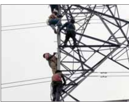
सूचना मिलते ही प्रशासनिक अधिकारी, कोतवाली

पुलिस का स्टाफ व एनडीआरएफ की टीम पहुंची युवक टावर और कंडक्टर के बीच एक इंसुलेटर पर बैठ गया था। आगे बढ़ता तो उसे करंट का झटका भी लग सकता था। युवक को नीचे आने के लिए कहा जा रहा था, लेकिन वह उतर नहीं पा रहा था। छत्तीसगढ़ के कोरबा पावर प्लांट के सब-स्टेशन से उमरिया जिले के बिरसिंहपुर पाली सब-स्टेशन बिजली आती है। विद्युत आपूर्ति रोकने के लिए मुंबई से अनुमति ली गई। दोपहर करीब 2.30 से 6.05 बजे तक हाईटेंशन टावर लाइन से विद्युत सप्लाई बंद कराई गई।